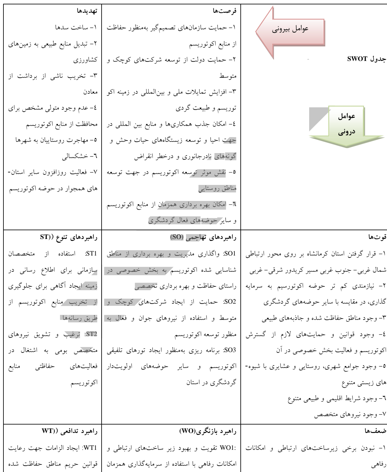
جدول ۳- ماتریس SWOT برای استخراج استراتژی های ممکن

استراتژی قوت -فرصت (SO)، ضعف-فرصت (WO)، قوت-تهدید (ST) و ضعف-تهدید (WT) در جدول (۳) قرار گرفته اند.