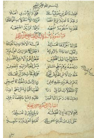
تصویر ۱: صفحات نخست عروۀ الاسطرلاب و نظم الحساب در کتابخانه ملی پزشکی آمریکا (NLM)