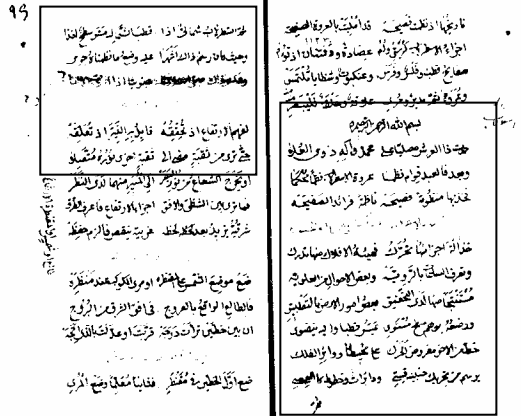
تصویر ۳: عروقه لاسطربلاب (بخش‌هایی که در مستطیل قرار داده شده است، مطالبی است که در صفحه نخست نسخه آمریکا وجود دارد)