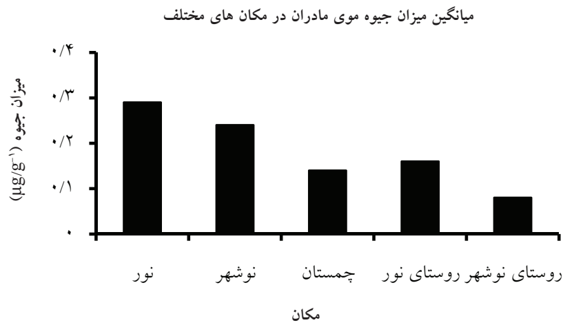
شکل ۲: بررسی اثر پارامتر مکان زندگی بر میزان جیوه موی مادر