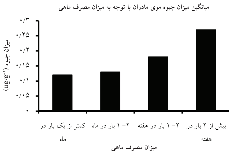
شکل ۴: اثر میزان مصرف ماهی مادر بر روی میزان جیوه مو و شیر مادر