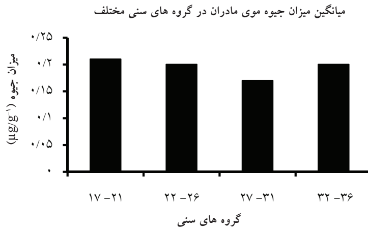
شکل ۱: بررسی اثر پارامتر سن بر میزان جیوه موی مادران