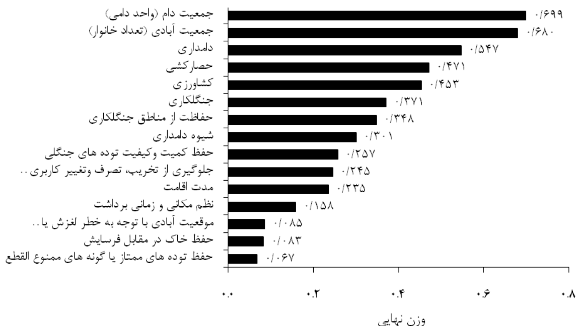
شکل ۲- مقادیر وزن نهایی هر یک از زیرمعیارها به صورت نزولی