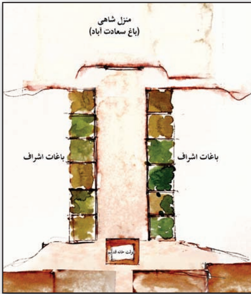
تصویر ۱. پلان محدوده خیابان برگرفته از توصیفات عبدی بیگ و سیاحان خارجی.

صفوی ترسیم کنیم. تصویری که مقایسه آن با فضای خیابان در باغ سعادت آباد که عبدی بیگ در توصیف باغ هم زمان به صورت ویژه به آنها می‌پردازد و همچنین قرار دادن این تصویر بازنمایی شده در کنار تصاویر و تفصیلات از خیابان در باغ ایرانی که قدمتی چند هزار ساله دارد، نتایج قابل توجهی را به دست می‌دهد.