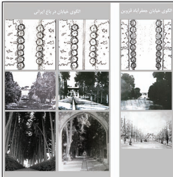
تصویر ۳. مقایسه و تطبیق الگوی خیابان در باغ ایرانی و خیابان جعفرآباد قزوین، مأخذ: نگارنده.

Fig3. A comparison between the architecture design of Khyaban in Persian garden and the architecture design of the Jafar-Abad Khyaban in Qazvin. Source: Author.