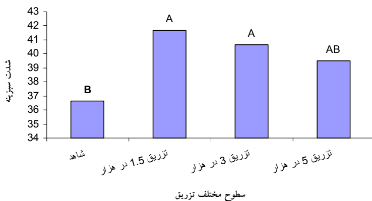
(شکل ۴) - اثر سطوح مختلف تزریق سولفات روی در تنه بر شدت سبزینه برگ