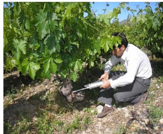
(شکل ۱) - نحوه تزریق سولفات روی با گریس پمپ تغییر یافته به تنه بوته مو