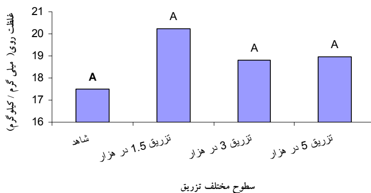
(شکل ۳) - اثر سطوح مختلف تزریق سولفات روی در تنه بر غلظت روی برگ