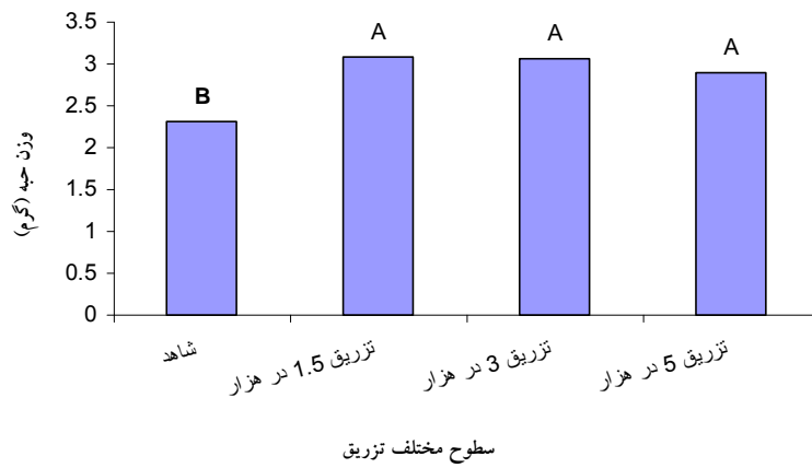
(شکل ۵) - اثر سطوح مختلف تزریق سولفات روی در تنه بر وزن حبه