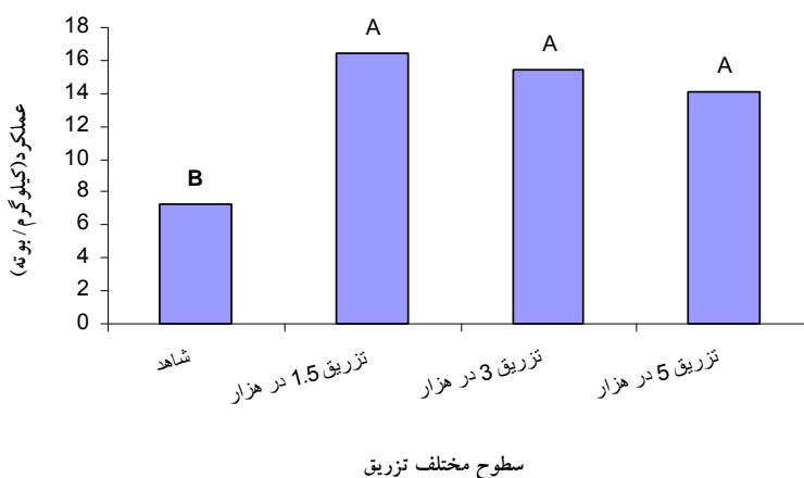
(شکل ۲) - اثر سطوح مختلف تزریق سولفات روی در تنه بر عملکرد انگور

بعنوان یک کوفاکتور در سنتز هورمون اکسین است که با سنتز کافی این هورمون اندازه سلول‌ها افزایش می‌یابد. احتمالاً افزایش طول