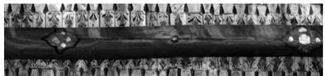
تصویر ۱۴- نقوش روی تیر حمال، سقف مسجد ضریح، مراغه، آذربایجان شرقی.