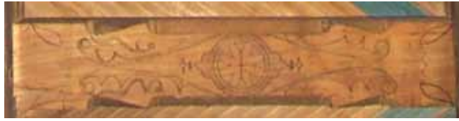
تصویر ۷- نمایی از تیرهای حمال فرعی / پردو با نقوش گیاهی، مسجد جامع ایبانه.