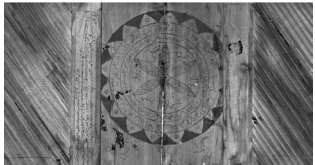
تصویر ۱۳- نمایی از قاب چوبی، سوره آیه الکرسی، و ان یکاد، مسجد جامع ایبانه.