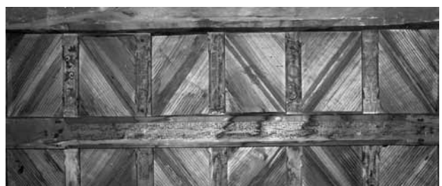
تصویر ۱۵- نمایی از تیر حمال، حاوی آیات قرآنی، سقف شبستان مسجد جامع ایبانه.