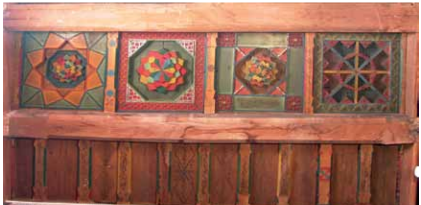
تصویر ۶- نمایی از پرده‌ها در کنار قاب‌های چوبی، حاوی کتیبه با مضامین مختلف، سقف مسجد جامع ایبانه.

پرده‌های مساجد چوبی آذربایجان شرقی با استفاده از نقوش گیاهی، اشکال و موضوعات خوشنویسی با رنگ مشکی و در قالب: اسماء جلاله، کلمات، عبارات و جملات کوتاه نظیر: بسم الله الرحمن الرحیم، یا غفار الذنوب، یا برهان، یا ستار العیوب، یا سُبْحان، یا علی ادرکنی، یا غفار، یا محمد یا علی، الله، یا قاضی الحاجات، تاریخ احداث یا تعمیر مساجد و بعضاً ذکر مصیب در ثنای اهل بیت؛ با خط نستعلیق و با رنگ مشکی مزین شده‌اند. ۳۳ در داخل مسجد جامع ایبانه نیز از پرده استفاده شده است. (تصویر ۶) پرده‌های سقف مسجد جامع ایبانه نیز به نقوش گیاهی (تصویر ۷)، هنر خوشنویسی حاوی اشعار با خط نستعلیق، آیات قرآنی به خط ثلث ۳۴ (تصویر ۸) و مواد تاریخی به خط نسخ ۳۵ با رنگ مشکی مزین شده است.