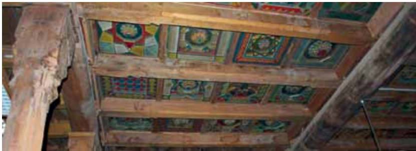
تصویر ۹- چپ، قاب‌های چوبی با طرح‌های شمشه، نمای کلی از سقف، مسجد جامع ایبانه.

هنر معرق ۳۹ همراه با رنگ آمیزی از تکنیک به کار رفته در تزئین قاب است که با میخ‌های آهنی یا چوبی بر روی تخته‌های زیرین متصل شده است. (تصویر ۱۱) برای رنگ آمیزی این قاب‌های مربع شکل از رنگ‌های قرمز، زرد، آبی، سبز، سفید و نارنجی و در نوشته‌ها رنگ سیاه استفاده می‌شود. نقاشی روی چوب با استفاده از نقوش گیاهی، ختایی و اسلیمی ۴۰ (تصویر ۱۲) از جمله هنرهای دیگری است که در مسجد جامع ایبانه به کار رفته است.