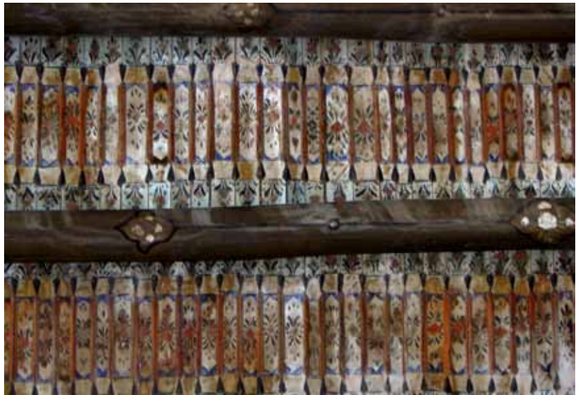
تصویر ۵- راست، طرح و شکل پرده‌ها مسجد ضریر، نقوش گیاهی، شهرستان مراغه، آذربایجان شرقی.

پرده‌ها در کنار هم روی تیرهای حمال، با فشار و بدون استفاده از میخ یا ابزاری دیگر قرار گرفته و به هم متصل شده است. ۳۳