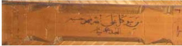
تصویر ۸- نمایی از تیرهای حمال فرعی / پردو، آیات قرآنی، خط ثلث، مسجد جامع ایبانه.