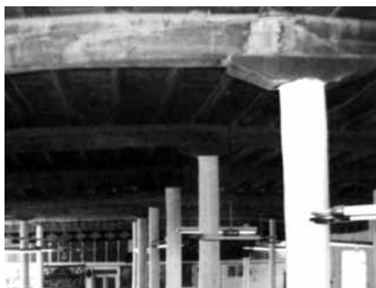
تصویر ۱۸- نمایی از سرستون مسجد محراب، آذرشهر، آذربایجان شرقی.