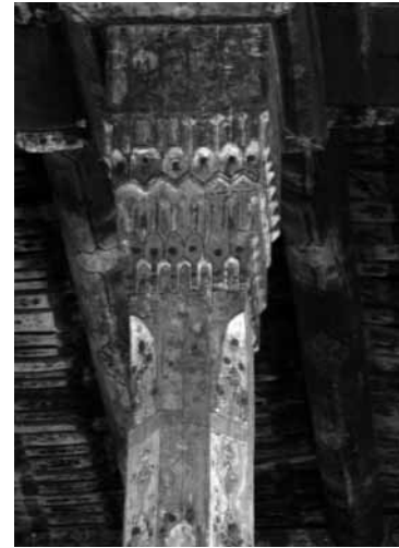
تصویر ۱۶- نمایی از سرستون مسجد مهرآباد، بناب، آذربایجان شرقی.

رنگ‌های استفاده شده در تزئین سرستون‌های مساجد آذربایجان شرقی، معمولاً قرمز، سفید، مشکی و آبی است. در این سرستون‌ها علاوه بر تزئینات نقاشی با موضوعیت گل و بوته‌های اسلامی، عباراتی نظیر اسماء جلاله، آیات، اشعار و... خوشنویسی نیز دیده می‌شود. (تصویر ۱۹) در اجرای مقرنس سرستون‌های شبستان مساجد آذربایجان شرقی از تخته و قطعات چوب،