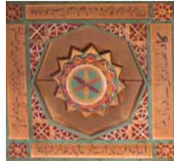
تصویر ۱۱- قاب چوبی هنر معرق با رنگ آمیزی، کتیبه‌ای همراه با نام استادکار (استادعلی)، مسجد جامع ایبانه.