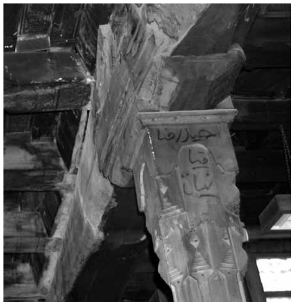
تصویر ۲۱- نمایی از سرستون در شبستان طبقه دوم مسجد جامع ایبانه.