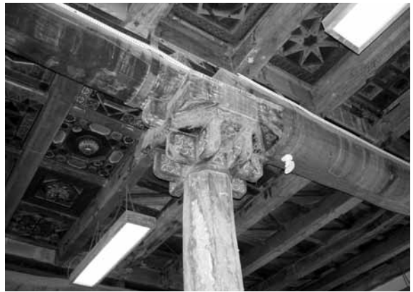
تصویر ۲۰- نمایی از سرستون شبستان مسجد جامع ایبانه.

آنچه از ظاهر سرستون پیداست که شبیه به بال کرکس است ظاهراً از دو قسمت مجزا تشکیل شده که به نظر می‌رسد با ابزاری شبیه به میخ صفحه هشت‌ضلعی آن به قسمت زیرین متصل شده و قسمت زیرین هم از تخته‌های زبانه‌شکل در کنار هم قرار گرفته است. (تصویر ۲۱)