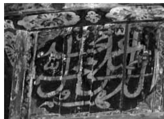
تصویر ۱۹- ذکر صلوات، سرستون شبستان مسجد ضریر، مراغه، آذربایجان شرقی.