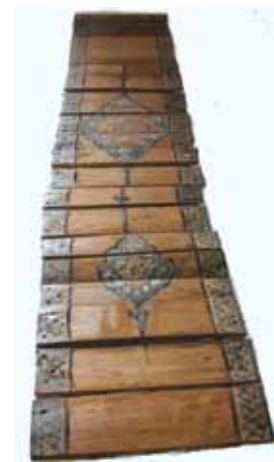
تصویر ۳- نقوش ترنج، نمایی از تخته‌های چوبی، قسمت زیرین صندوقچه چوبی، مسجد ملارستم، مراغه، آذربایجان شرقی.