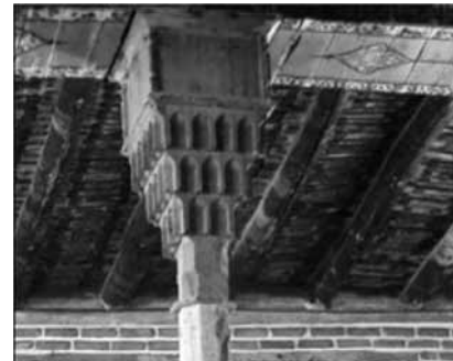
تصویر ۱۷- نمایی از سرستون مسجد ملارستم، مراغه، آذربایجان شرقی.