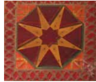
تصویر ۱۰- قاب چوبی، معرق روی چوب، طرح شمشه پاباریک، مسجد جامع ایبانه.