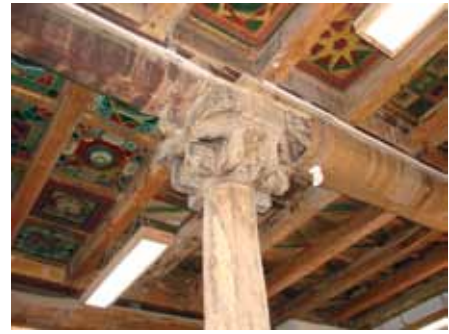
تصویر ۱- نمایی از شاه تیر، سقف مسجد جامع ایبانه.

در ساخت صندوقچه‌ها از چوب سپیدار و در نقاشی روی آن‌ها از رنگ‌های محلول در آب استفاده می‌شده است. ۳۱ صندوقچه‌ها بخش اندکی از سقف شبستان مساجد آذربایجان شرقی را شامل می‌شود و همان‌طور که گفته شد صرفاً جنبه تزئینی دارند قسمت عمده