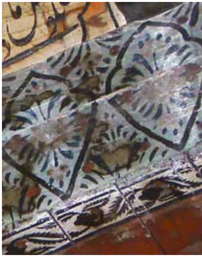
تصویر ۴- نمایی از طرح قسمت‌های جانبی صندوقچه‌های چوبی، نقوش گیاهی، مسجد جامع میدان، بناب، آذربایجان شرقی.

سقف مساجد آذربایجان شرقی را پرده‌ها پوشانده‌اند پرده‌ها از جمله عناصری هستند که کارکرد سازه‌ای- تزئینی در معماری مساجد چوبی داشته و از تخته‌های باریک برش خورده تشکیل شده است. (تصویر ۵)