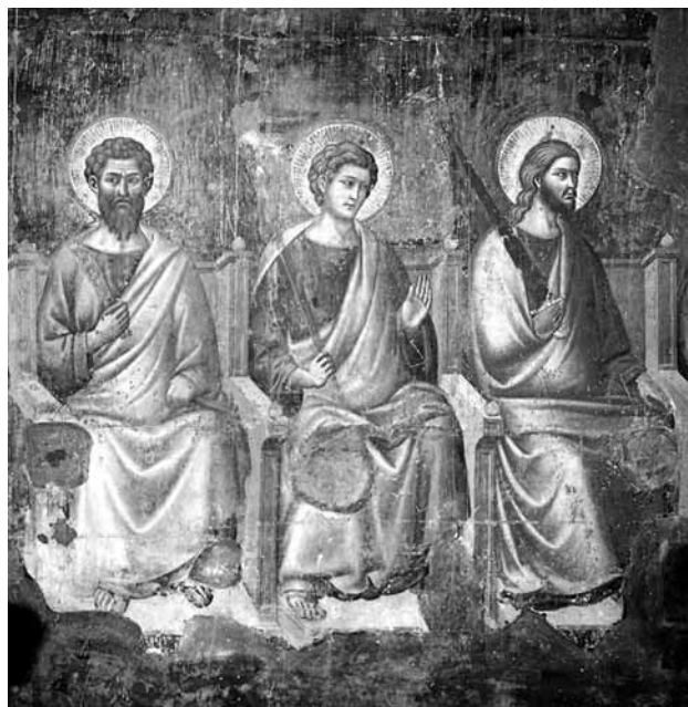
تصویر ۱۰- حضرت مسیح همراه با دو تن از حواریون، کلیسای در تراستوره روم.

و اما نگاره دیگری که مربوط به برگی دیگر از نسخه آثار الباقیه است، نگاره‌ای منحصر به فرد در تاریخ نگارگری ایرانی - اسلامی است. در این نگاره نمایندگان مسیحی نجران (در سمت چپ) به ملاقات پیامبر اکرم (ص) آمده‌اند. ۳۶ (تصویر ۱۱)