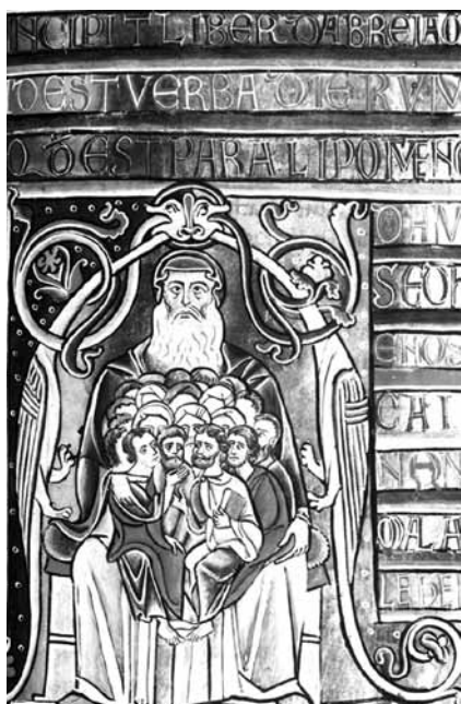
تصویر ۱۲- مسیحیان و مسلمانان در آغوش حضرت ابراهیم، انجیل.