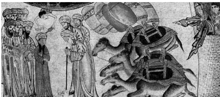
تصویر ۷- احترام گذاشتن بحیرای مسیحی به حضرت محمد (ص)، جامع‌التواریخ، دانشگاه ادینبرو.