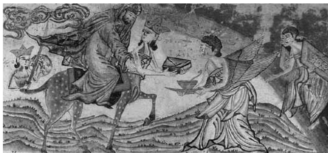
تصویر ۱۶- معراج پیامبر، جامع التواریخ، دانشگاه ادینبرو.

در این نگاره پیامبر اکرم (ص) سوار بر براق، موجودی با بدنی همچون اسب و سری انسانی، ترسیم شده است. در دستان این موجود خارق‌العاده، نسخه کتابی است که می‌بایست قرآن کریم، معجزه بزرگ پیامبر (ص) باشد. در مقابل او جبرئیل دیده می‌شود که جامی زرین در دست دارد. هر چند ابعاد نگاره، عریض و به شکل طومار چینی است، ولیکن تأثیر عناصر چینی در این نگاره کمتر مشاهده می‌شود. (تصویر ۱۶)