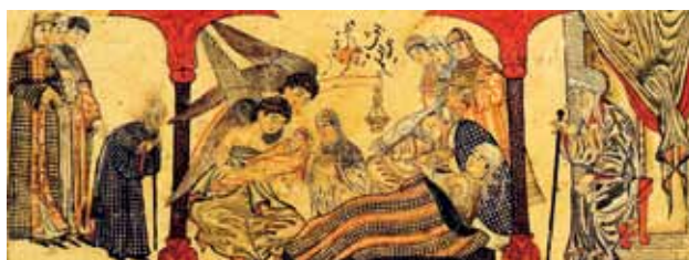
تصویر ۳- تولد حضرت محمد(ص)، جامع‌التواریخ، دانشگاه ادینبرو.

در نگاره مربوط به تولد حضرت مسیح، یوسف نجار حضرت عیسی را در دست گرفته و در دور تا دور تخت حضرت مریم مردانی ایستاده‌اند که دست به دعا برداشته‌اند و چهره‌های نگران و مشوشی دارند. احتمال می‌رود که سه تن از آن‌ها، سه حکیم زرتشتی باشد. ۲۰ (تصویر ۴)