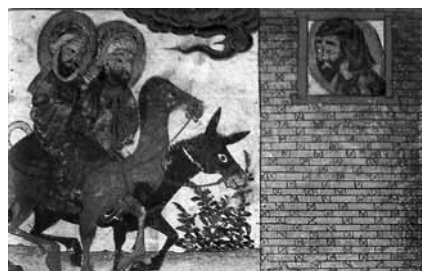
تصویر ۱۳- حضرت محمد همراه حضرت مسیح، آثارالباقیه.

است که در پاریس مصور شده است. در بسیاری از نگارگری‌های بیزانس، انجیل (کتاب مقدس مسیحیان) در دست مسیح و یا پیروانش قرار گرفته ولیکن در تصاویر جامع‌التواریخ و یا آثارالباقیه کتاب مقدس مسلمانان در دست پیامبر و یا پیروانش مشاهده نمی‌شود. نگاره دیگری که از نسخه آثارالباقیه گرفته شده حضرت محمد (ص) و حضرت عیسی (ع) را با همدیگر نشان می‌دهد. (تصویر ۱۳)