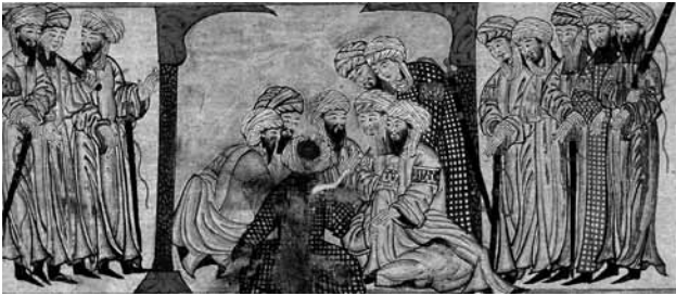
تصویر ۱۴- سران قریش در حال توطئه علیه حضرت محمد و یارانش، جامع التواریخ.

از دو جانب گروه اصلی، دو طرح فرعی به شدت متفاوت، دیده می‌شوند. سنت شمایل‌سازی هنرمند را ملزم کرده که رخداد بریدن گوش خادم کشیش اعظم را به دست پطرس نقاشی کند، و جو تو این صحنه را پشت مأمور باشلق دار سمت چپ که سعی دارد راه را بر یکی از حواریان وحشت زده گریزان ببندد پنهان کرده است. کندو کاوی که جو تو در مورد شخصیت و احساسات کشیش اعظم در سمت راست انجام می‌دهد و دنیای درونش را یکسره با حالت اندامش بیان می‌کند به وضوح گویاست. او به آغوش خیانتکارانه در مرکز اشاره می‌کند. گویی، در ضمن این حرکت دو دل است، به طوری که توانش نیست که رذالت در خیانت یهودا را تمام و کمال بر ملا کند. انگشتش کج، و آغاز به منقبض شدن می‌کند، و حجم‌های جامه‌اش که در چین و چروک‌های ریز به لرزه خفیف افتاده موج‌های کوچکی را نشان می‌دهد که با یورش ناگهانی ردای یهودا به جلو در تضادند. پیداست که هاله مسیح از اندوه شکل گرفته و در ژرف‌نمایی نشان داده شده است. ۴۳