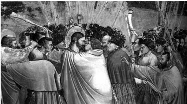
تصویر ۱۵- خیانت یهودا به حضرت مسیح، دیوارنگاره، نمازخانه آرنو، پادوا، ایتالیا.

از دو جانب گروه اصلی، دو طرح فرعی به شدت متفاوت، دیده می‌شوند. سنت شمایل‌سازی هنرمند را ملزم کرده که رخداد بریدن گوش خادم کشیش اعظم را به دست پطرس نقاشی کند، و جو تو این صحنه را پشت مأمور باشلق دار سمت چپ که سعی دارد راه را بر یکی از حواریان وحشت زده گریزان ببندد پنهان کرده است. کندو کاوی که جو تو در مورد شخصیت و احساسات کشیش اعظم در سمت راست انجام می‌دهد و دنیای درونش را یکسره با حالت اندامش بیان می‌کند به وضوح گویاست. او به آغوش خیانتکارانه در مرکز اشاره می‌کند. گویی، در ضمن این حرکت دو دل است، به طوری که توانش نیست که رذالت در خیانت یهودا را تمام و کمال بر ملا کند. انگشتش کج، و آغاز به منقبض شدن می‌کند، و حجم‌های جامه‌اش که در چین و چروک‌های ریز به لرزه خفیف افتاده موج‌های کوچکی را نشان می‌دهد که با یورش ناگهانی ردای یهودا به جلو در تضادند. پیداست که هاله مسیح از اندوه شکل گرفته و در ژرف‌نمایی نشان داده شده است. ۴۳