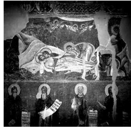
تصویر ۱۷- جسد حضرت مسیح، دیوارنگاره، دیوار شمالی کلیسای مقدس کاتولیک شهر اسکوبچه در یوگسلاوی سابق، نیمه دوم سده دوازدهم / ششم.

چرا که پیامبر برای سفر خود از آسمان گذر می کند و مسیح نیز برای رسیدن به لقاء الهی این مرحله را طی می کند. به اعتقاد مسلمانان، شخص دیگری به جای مسیح به صلیب کشیده شده و مسیح به عرش رفته و همراه با امام زمان ظهور خواهد کرد. ۴۸