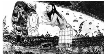
تصویر ۵- غسل تعمید حضرت مسیح(ع)، آثارالباقیه.

در این نقاشی مسیح و یحیی را در کنار فرشته‌ها می‌بینیم. همه آن‌ها هاله دور سر دارند و یحیی با دست راستش مسیح را تطهیر می‌کند. مسیح نیز با چهره‌ای خندان در وسط ایستاده