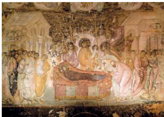
تصویر ۴- تولد حضرت مسیح(ع)، نقاشی دیواری، دیوار غربی کلیسای جامع سن پترزبورگ، سده سیزدهم / هفتم.