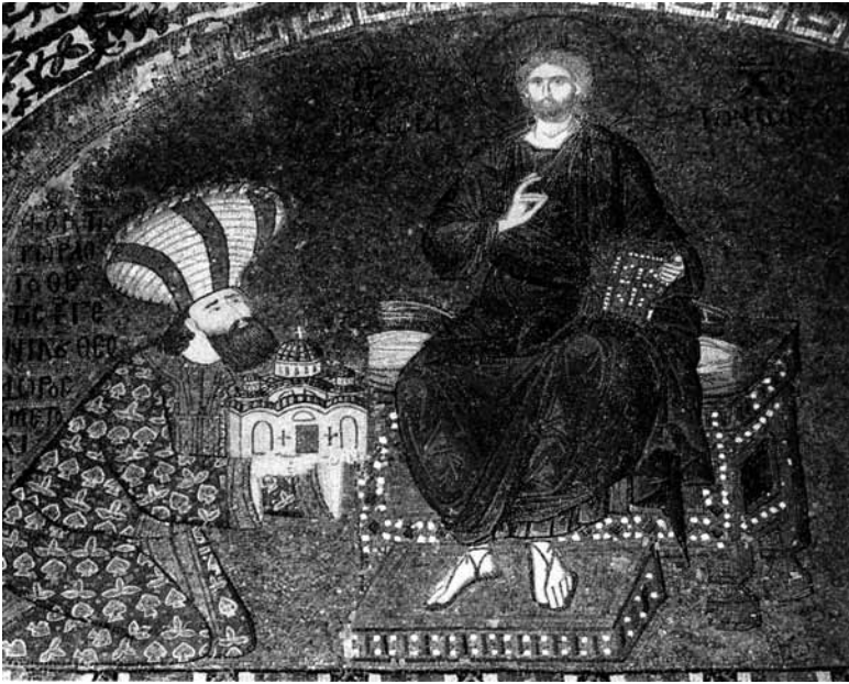
تصویر ۸- احترام تنودور به حضرت مسیح، نقاشی دیواری با تکنیک موزائیک، کلیسای کرا، ترکیه.

در این صحنه محاسن حضرت همانند بیشتر تصاویر حضرت مسیح در دوران بیزانس با رنگ روشن نشان داده شده است. نوع نزدیکی چهره به صحنه، چهره‌پردازی نگارگری ایرانی را به یاد می‌آورد. ولیکن نوع پردازش و حالت چهره‌ها شباهتی به نگاره‌های دوران ایلخانی ایرانی ندارد. در این تصویر هاله‌ای از نور پشت سر حضرت مسیح کشیده شده در این هاله نیز شکل صلیب به تصویر در آمده است. نوع پردازش کلاه تنودور با شکل متفاوت و جالب در کمتر نگاره‌ای از این دوره قابل مشاهده است.