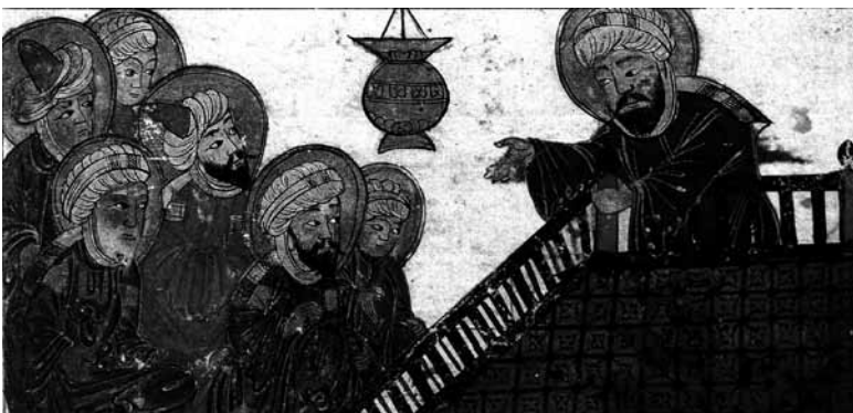
تصویر ۹- پیامبر همراه با یارانش، آثارالباقیه.

در این تصویر پیامبر همراه با یارانش به تصویر کشیده شده‌اند. مضمون اصلی این تصویر بحث و مجادله‌ای است که درباره رؤیت هلال ماه نو رخ داده است. ۳۰ در تصویر، پیامبر بر بالای منبر نشسته و در پایین، جمعیتی از زن و مرد نشسته و چشم به دهان او دوخته‌اند، بر بالای سر جمعیت و مقابل چهره پیامبر (ص) قندیلی از سقف آویخته شده که می‌تواند نمادی از چراغ مصباح و بیانگر آن باشد که مسجد، محلی است که پیامبر (ص) مردم را به خیر و نیکی هدایت می‌کند. دیوارهای مسجد بسیار ساده و عاری از تزئین ترسیم شده