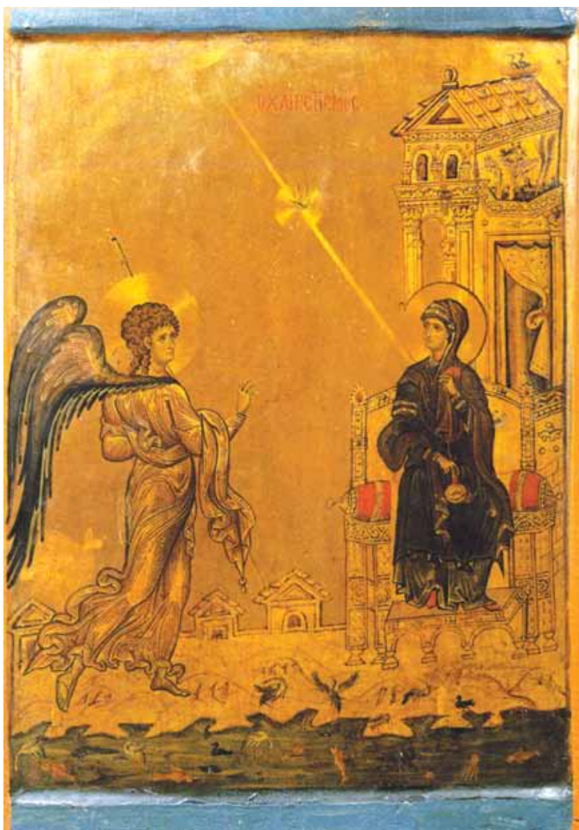
تصویر ۲- بشارت تولد حضرت مسیح، کلیسای کاترین در مصر، اواخر سده دوازدهم / ششم.

تصویر فوق متعلق به اواخر سده دوازدهم / ششم و مربوط به کلیسای تاریخی کاترین در کوهپایه‌های کوه سینا در مصر و البته اندکی متأثر از بیزانس در دوره‌های پیشین است در عین حال شیوه نگارگری شمایل‌ها نوعی پویایی و احساسی شاعرانه را به بیننده القا می‌کند. ۱۶ کشیدن نوری از آسمان به سمت حضرت مریم، تجسم وحی الهی از طرف فرشته به حضرت مریم را زیباتر می‌نمایاند. نوع خطوط جامه‌ها و بال‌های فرشته و چهره‌پردازی معصومانه و نگران حضرت مریم همراه با قامت کشیده و نحوه‌پردازش عمارت‌ها هنر بیزانس را به خوبی نشان می‌دهد. علاوه بر آن حضور جانوران در پایین تصویر به نحوی است که در نگاره‌های نقاشی بیزانس کمتر مشاهده می‌شود. در قرون وسطی و در نقاشی‌های بیزانسی آثار بسیاری را می‌توان یافت که تاثیر نقوش شرقی را به خوبی روی آثارشان باز می‌تاباند. ۱۷ به طور نمونه در همین تصویر، جانوران و نحوه‌پردازش آن‌ها در پایین تصویر حاکی از این مطلب است.