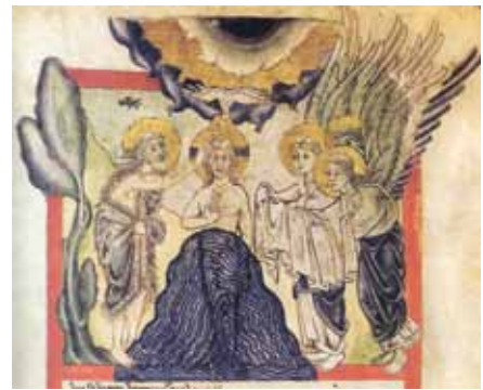
تصویر ۶- غسل تعمید حضرت مسیح(ع)، انجیل مارک.