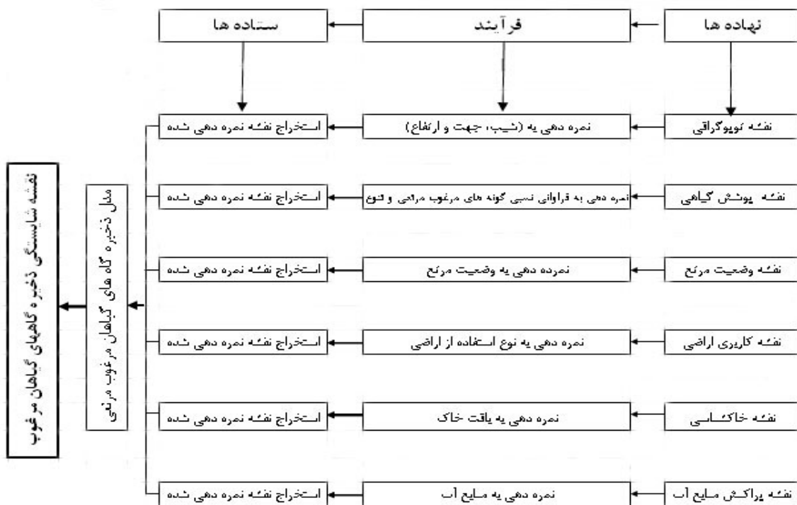
شکل ۱- مدل شایستگی ذخیره گاه های گیاهان مرغوب مرتعی

در بررسی مدل ذخیره گاه های گیاهان مرغوب مرتعی شش معیار توپوگرافی (شیب، جهت و ارتفاع)، تنوع و درصد حضور گونه های