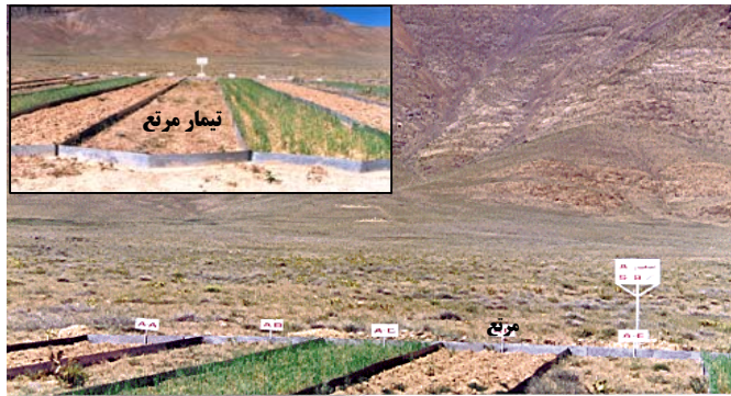
شکل ۱- موقعیت کلی منطقه مورد مطالعه و شمای کلی پلات‌های مورد بررسی

در زمین فرو برده شد) محصور شد. در انتهای هر پلات لوله خروجی روان‌آب تعبیه که به ظروف مدرج جمع‌آوری کننده روان‌آب و رسوب هدایت شد. تیمار