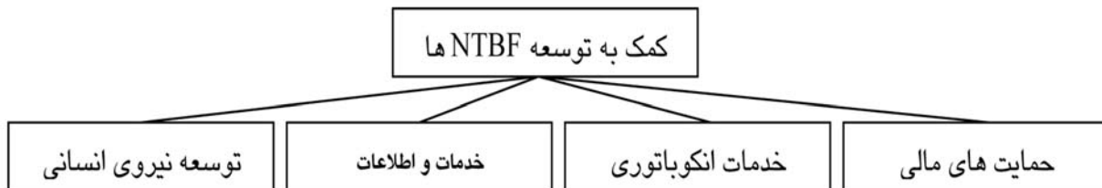
شکل ۱- دسته بندی ابزارهای سیاستی حمایت از NTBFها

حاصل مرحله قبل اختصاص یک عدد فازی به هر ابزار سیاستی است؛ در نتیجه، برای این که این ابزارها قابل مقایسه و اولویت بندی باشند، باید اعداد فازی مذکور غیر فازی شوند.