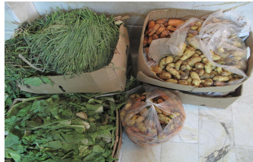
شکل شماره (۱): پسماندهای تهیه شده از میدان میوه و تره بار (خوراک کرمها)

نگهداری کرمها از جعبه های چوبی به ارتفاع ۳۰ سانتیمتر، عرض ۴۰ سانتیمتر و طول ۵۰ سانتیمتر استفاده شد (شکل شماره ۲). بر روی دیواره ها و کف محفظه ها، سوراخ هایی با قطر ۲/۵ سانتیمتر به منظور تبادل هوای بستر با محیط اطراف ایجاد شد. محفظه های نگهداری در طول مدت آزمایش (۷۵ روز)، در زیرزمین تاریک و مرطوب با دمای حدود ۲۵ درجه سلیزیوس قرار داده شدند. رطوبت بسترها با اضافه کردن تناوبی آب در مواقع مورد نیاز، در طول آزمایش در محدوده ۶۵-۷۰ درصد ثابت نگه داشته شده بود (رستمی، نبی و اسلامی ۱۳۸۷). در ابتدای آزمایش، ۳۰۰ گرم مخلوطی از کرم های جوان و بالغ به محفظه های نگهداری که شامل بسترهای مختلف به همراه خوراک (پسماندهای آلی) بودند، اضافه شد.