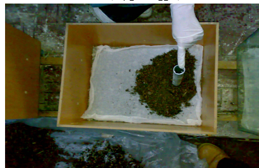
شکل شماره (۲): محفظه نگهداری در حال اضافه کردن مواد بستری