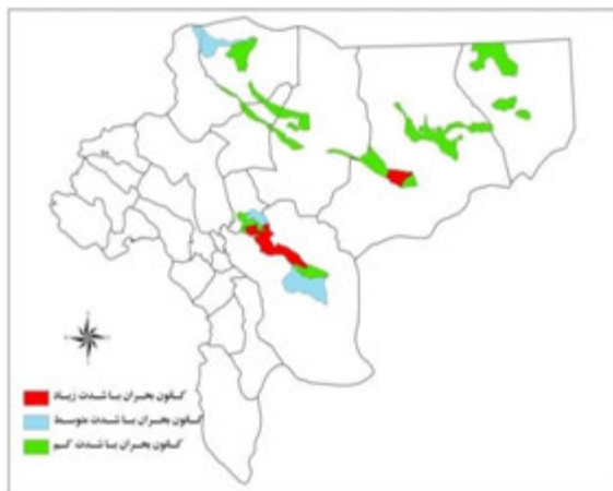
نقشه شماره (۲): نقشه کانون‌های بحرانی فرسایش بادی