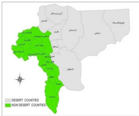
نقشه شماره (۱): شهرستان‌های بیابانی استان اصفهان