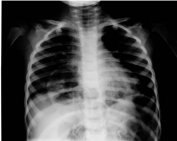
شکل شماره ۱- عکس قبل از عمل که لوپ‌های کولون در حاشیه راست قلب دیده می‌شود.

کولون به سمت شکم جا انداخته شد و نقص موجود در دیافراگم با سوچورهای نایلون ۱-۰ ترمیم شد. پس از جراحی حال عمومی بیمار خوب بوده و در طی یک سال و نیم پیگیری، بیمار بدون علامت بوده و مشکل خاصی ندارد.