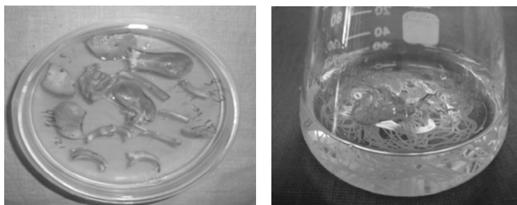
شکل شماره ۳- القا و کشت ریشه‌های موین گیاه خارمریم Silybum marianum