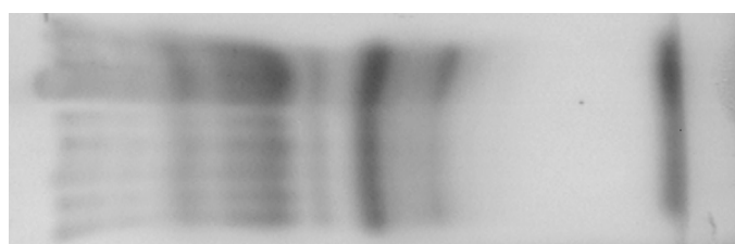
شکل شماره ۲- تصویر TLC اسانس گیاه بدون گل Stachys acerosa