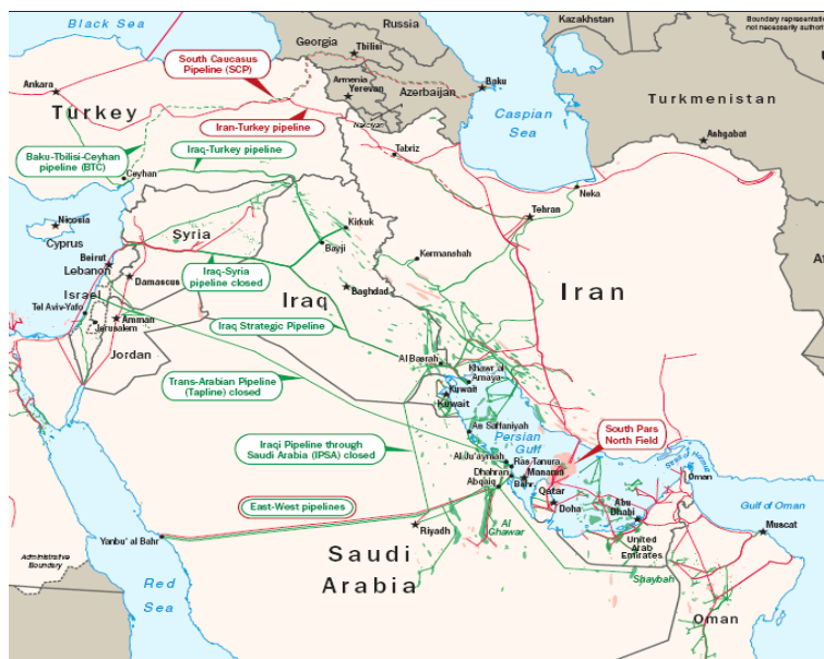
نقشه ۳: ذخایر نفت و گاز خلیج فارس (EIA, 2008, 1)

آن، از دیرباز مورد توجه قدرت‌های جهانی بود و تلاش برای اعمال سلطه و حفظ نفوذ در این منطقه به یکی از سیاست‌های راهبردی آنها تبدیل شده است.