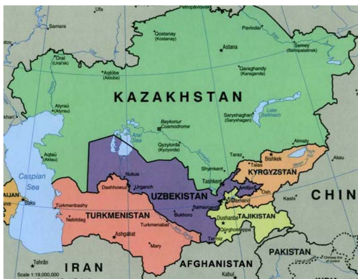
نقشه ۲: کشورهای منطقه آسیای مرکزی (Politicspeaksvalleys, 2009, 2)

همچنین این اولین بار است که نیروهای نظامی ایالات متحده در کمتر از ۲۰۰ مایلی مرزهای غربی کشور چین مستقر شده‌اند. وضعیت کنونی این احساس را به پکن القا می‌کند که تاکتیک محاصره با یک سد، توسط ایالات متحده علیه منافع این کشور در حال انجام است (Ferrari, 2003, 10). بر این اساس، چین مصمم است تا در برخی عرصه‌ها هماهنگ با جبهه‌ی مسکو در مقابل غرب ظاهر شود و در همین راستا با روس‌ها در چارچوب سازمان همکاری شانگهای ۲۲ پیش‌می‌رود و مایل است تا همکاری استراتژیک و نزدیکی را با اعضای این سازمان در برابر افزایش حضور ناتو و ایالات متحده در حیطه‌ی نفوذ خود در اوراسیای مرکزی پایه‌ریزی کند.