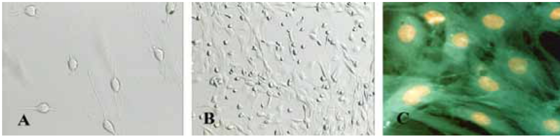
شکل ۱- مشاهده سلول‌های BMSCs القا شده توسط دپرنیل (تصویر A) و القا نشده (تصویر B) توسط میکروسکوپ اینورت (بزرگنمایی A - 400 X و B - 200X). C - رنگ‌آمیزی ایمنوفلورسانس که سیتوپلاسم سلول‌های استرومایی به آنتی‌بادی فیبرونکتین واکنش داده به رنگ سبز و هسته سلول‌ها با اتیدیوم بروماید به رنگ قرمز متمایل به زرد مشاهده می‌شوند (بزرگنمایی 1000X).