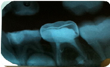
شکل ۲: پیگیری یک ماهه

که تقریباً به اندازه قطر فایل شماره ۳۵ بود. پس از طی شدن زمان پیگیری آثاری از تحلیل استخوان و التهاب در اطراف ماده مشاهده نشد. (شکل ۲)