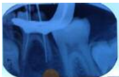
شکل ۱: رادیوگرافی تهیه شده با فایل در زمان پرفوراسیون

بود. به همین جهت، در جلسه درمانی، پس از بلاک عصب آلوئولار تحتانی با یک کارپول لیدوکائین ۲٪ و اپی نفرین ۱/۱۰۰۰۰۰ و قرار دادن رابردم، حفره دسترسی کامل شد و فایل‌های اولیه (برای کانال‌های مزیال فایل شماره ۱۵ و برای کانال‌های دیستال فایل شماره ۲۰) جهت تعیین طول کارکرد در کانال‌ها قرار داده شده و طول کارکرد توسط رادیوگرافی تایید شد. پس از تایید طول کارکرد، فایلینگ و شستشو با نرمال سالین انجام شد. در حین کار، از کانال دیستال خون‌ریزی مداوم وجود داشت که در رادیوگرافی پری اپیکال به عمل آمده از دندان، یک نقطه پرفوراسیون در ۱/۳ میانی تا ۱/۳ اپیکال ریشه دیستال مشاهده گردید. (شکل ۱)