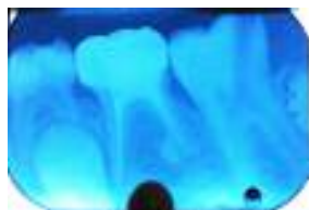
شکل ۳: پیگیری شش ماهه

یک ماه بعد بیمار جهت معاینات پیگیری مراجعه کرد و دندان مورد نظر تحت بررسی کلینیکی و رادیوگرافیکی قرار گرفت. ترمیم ناحیه پرپوراسیون بدون هیچ‌گونه ضایعه در ساختارهای حمایت کننده دندان (PDL و استخوان آلوئول) انجام شده بود. پیگیری دندان در فواصل ۳، ۶، ۱۲، ۲۱، ۲۴ ماه نیز انجام شد و ترمیم موفق ناحیه پرپوراسیون در تمام رادیوگرافی‌های به عمل آمده مشهود بود.