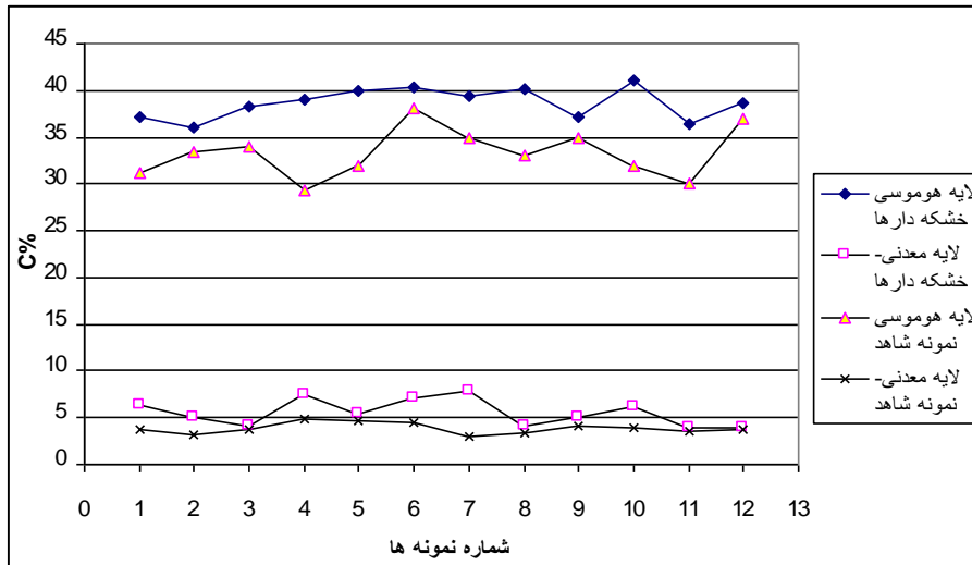
شکل ۲- مقدار ماده آلی اندازه‌گیری شده در تیمارهای مختلف

با توجه به نمودار ۲، مقدار کربن آلی لایه هوموسی خشکه‌دارها از نمونه‌های شاهد بیشتر است و به همین روال در لایه معدنی خشکه‌دارها نیز مقدار آن بیشتر است.