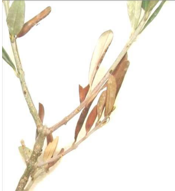
شکل ۱- علائم پژمردگی و خشکیدگی برگ‌های زیتون رقم زرد مایه‌زنی شده با جدایه E4 عامل بیماری ( V. dahliae )

حضور عامل بیماری، ترکیباتی همچون تایلوز و مواد ژلاتینی نیز دیده شد (شکل ۴).