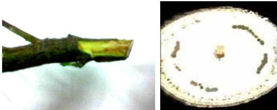
شکل ۲- خطوط ناپیوسته ایجاد شده در برش عرضی و طولی ساقه زیتون مایه‌زنی شده با ( V. dahlia )