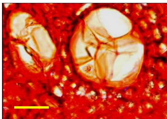
شکل ۴- تشکیل تیلوز در آوندهای نهال آلوده توسط میزان در راستای جلوگیری از انتشار عامل بیماری (مقیاس ۵۰ میکرون)

کوتاهی دچار زوال می‌شوند (صانعی و همکاران، ۱۳۸۳الف؛ Mac Cain, 2002). همچنین در تحقیق حاضر علی‌رغم ظهور علائم ظاهری در هفته‌های اولیه پس از مایه‌زنی عامل بیماری، تنها پس از ۱۲ هفته، تغییر رنگ آوندی به رنگ قهوه‌ای مایل به قرمز در برش‌های عرضی پایین ساقه اصلی مشاهده گردید که با نتایج به‌دست‌آمده از سایر تحقیقات مطابقت دارد (عطار، ۱۳۸۵؛ صانعی و همکاران، ۱۳۷۷؛ صانعی و همکاران، ۱۳۸۳). نتایج بررسی‌ها نشان می‌دهد که اگرچه تغییر رنگ آوندی از علائم مهم بیماری‌های آوندی در اغلب درختان