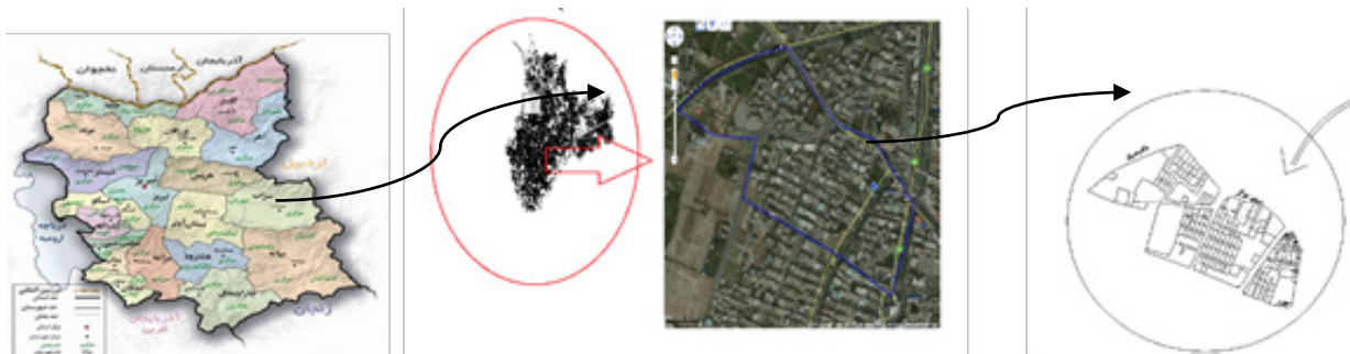
تصویر شماره ۱: پلان شهر و محدوده سایت، مأخذ: www.earth.google.com

به نظر می‌رسد که رویکرد جدا کردن کاربری‌های اصلی مثل کار و مسکن یکی از عوامل مؤثر در خلوت کردن خیابان‌ها و مراکز شهری، در هنگام شب است. به همین دلیل ایجاد تنوع در فعالیت‌ها و کاربری مختلط علاوه بر کمک به سرزندگی و جاذبه