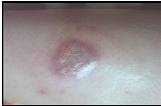
شکل ۶- (سه هفته پس از استعمال)