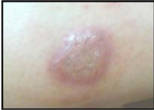
شکل ۵- دو هفته پس از استعمال