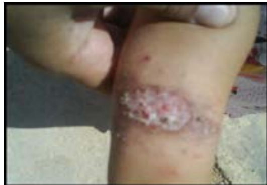
شکل ۷- اوایل درمان با گلوکانتیم