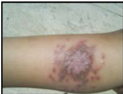
شکل ۸- چهار هفته پس از درمان با گلوکانتیم