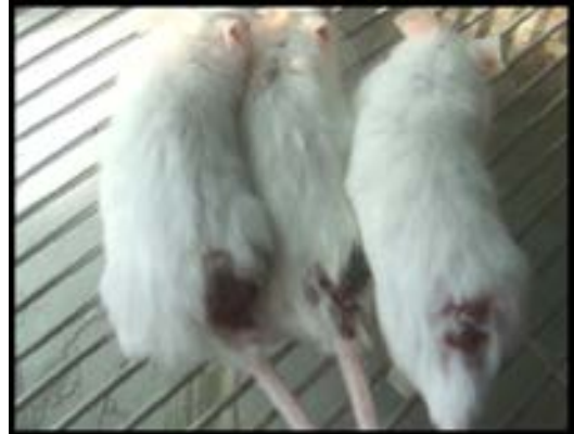
شکل ۱- ابتدا حیوان آزمایشگاهی