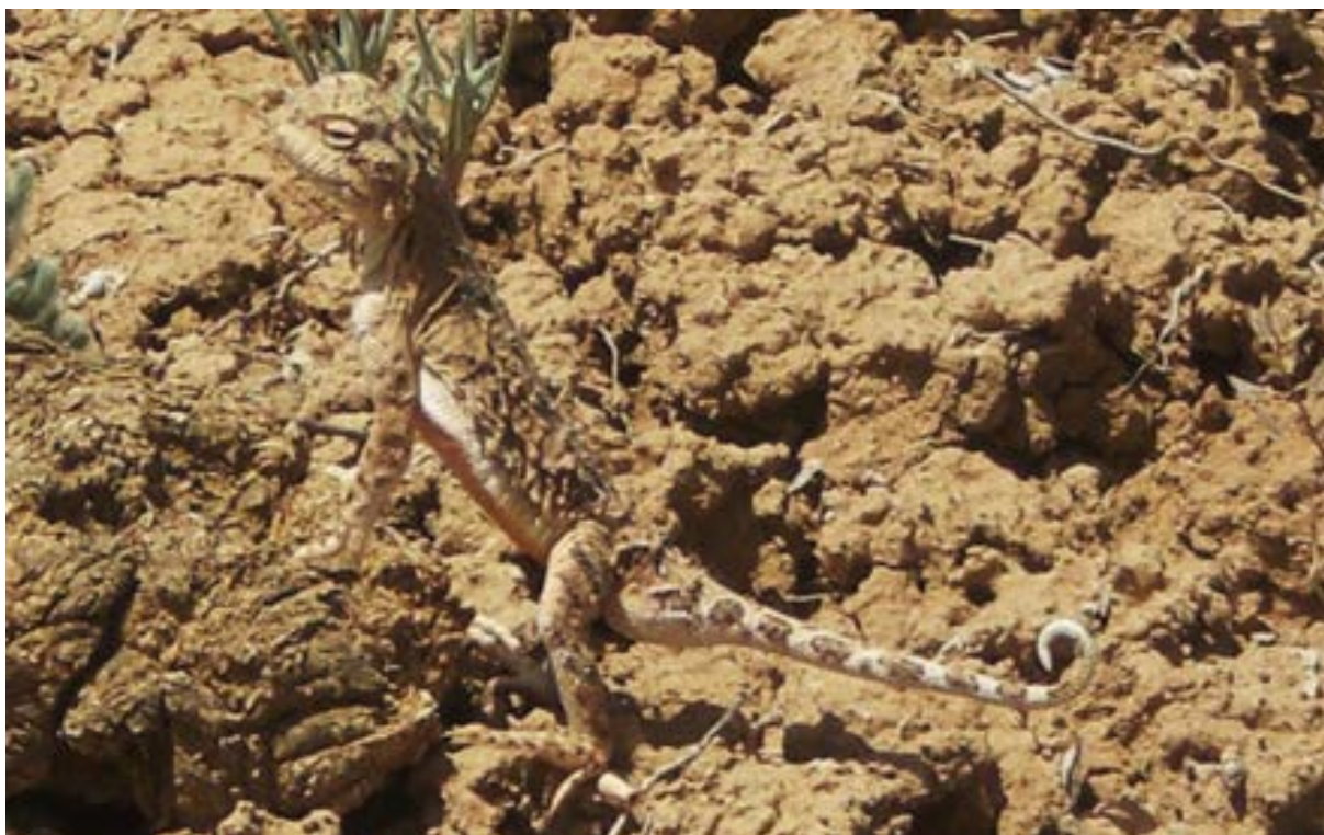
شکل ۳: آگامای سروزغی ایرانی (سال ۱۳۹۰، روستای سهیل آباد-تالاب میقان)