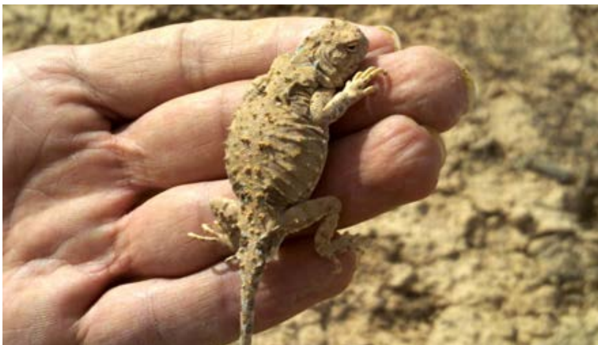
شکل ۲: آگامای سروزغی ایرانی (سال ۱۳۹۰، روستای سهیل آباد-تالاب میقان)