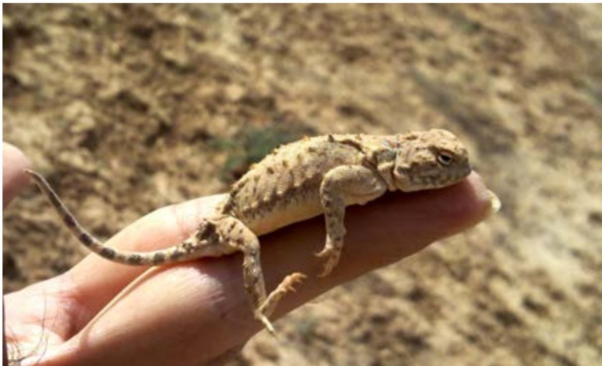
شکل ۱: آگامای سروزی ایرانی (عکس از بنفشه برادران رحیمی، سال ۱۳۹۰، روستای سهل آباد-تالاب میقان)