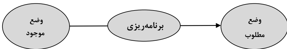
شکل شماره ۲- هدف و ماهیت برنامه‌ریزی

برنامه‌ریزی اقتصادی چیزی جز یک فرآیند اطلاع - تصمیم‌گیری نیست، فرآیندی که طی آن به صورت آگاهانه و ارادی، به منظور حصول به اهداف مشخص (مطلوب) اقتصادی مانند تولید ناخالص ملی، مصرف، سرمایه‌گذاری و... تصمیم‌گیری می‌شود (نظری، همان: ۲۰۷).