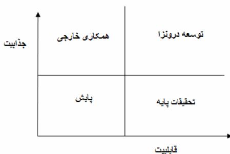
شکل ۱ ماتریس ارزیابی قابلیت - جذابیت [۱۱]

از تجمیع این سه دسته از اطلاعات، ماتریسی استخراج می‌شود که می‌توان از آن اطلاعات مورد نظر را روی یک نمودار دو بُرداری استخراج کرد و در آخر برای تکمیل راهبرد از آن بهره گرفت (شکل ۱).