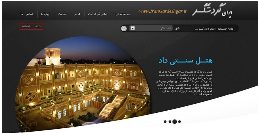
شکل ۲ صفحه اول سایت ایران گردشگر با امکان ثبت نام و عضویت کاربر

پس از اینکه کاربر وارد پروفایل کاربری می شود و عضویت خود را به منظور ارائه پیشنهاد ثبت می کند، به سمت مرحله استدلال نمونه محور هدایت می شود. در این مرحله، پانزده آیتم با توزیعی یکنواخت در پنج بخش مکان های تاریخی، تجاری، طبیعی، فرهنگی و مذهبی براساس تعداد کل آیتم های هر بخش نسبت به کل آیتم ها در پایگاه داده، به کاربر هدف عرضه می شود. با استفاده از نمونه های یاد شده کاربر هدف رفتارسنجی می شود. این رفتارسنجی به این صورت است که کاربر با توجه به میزان علاقه خود به مکان مورد نظر، رتبه ای بین ۱ تا ۱۰ به آن ها می دهد. از طریق این رتبه ها، علایق و رفتارهای کاربر در مورد مکان های گردشگری شبیه به مکان های یاد شده به راحتی قابل استخراج است.