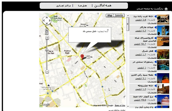
شکل ۵ نمایش فهرستی از مکان های مورد علاقه کاربر با استفاده از Google Map

پس از اتمام مراحل پالایش گروهی و پالایش محتوای محور، سیستم نتایج به دست آمده از این دو الگوریتم را با توجه به مجموع وزن پارامترهای هر مکان گردشگری مقایسه می کند و فهرستی از مکان های مورد علاقه کاربر را به صورت مرتب شده جهت نمایش روی Google Map ایجاد می کند (شکل ۵). مکان اولیه نمایش داده شده روی نقشه Google، هتل محل اقامت گردشگر است. کاربر این هتل را در مرحله تنظیمات سفر به صورت مستقیم مشخص کرده است.