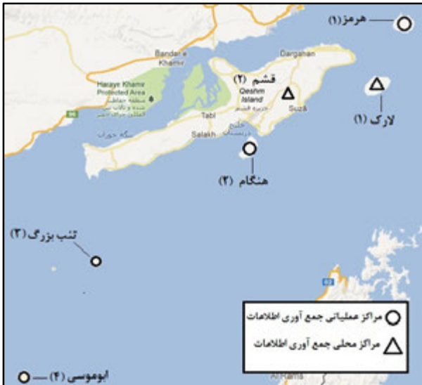
شکل ۳. مراکز فرضی محلی و عملیاتی جمع‌آوری اطلاعات راداری

اندیس z=1 نشان دهنده مرکز عملیاتی جمع‌آوری اطلاعات واقع در جزیره هرمز، اندیس z=2 نشان دهنده مرکز عملیاتی جمع‌آوری اطلاعات واقع در جزیره هنگام، اندیس z=3 نشان دهنده مرکز عملیاتی جمع‌آوری اطلاعات فرضی واقع در یکی از دو جزیره کاندیدا (یعنی جزایر ابوموسی و تنب بزرگ) است، در شکل (۳) مراکز محلی و عملیاتی جمع‌آوری اطلاعات راداری نمایش داده شده است. در تابع، R_{ij} نمایانگر رادار مستقر در مرکز عملیاتی j ام که به مرکز محلی جمع‌آوری اطلاعات i ام تخصیص داده شده است.