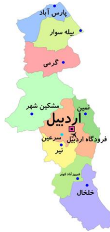
شکل ۱- نقشه جغرافیایی استان اردبیل