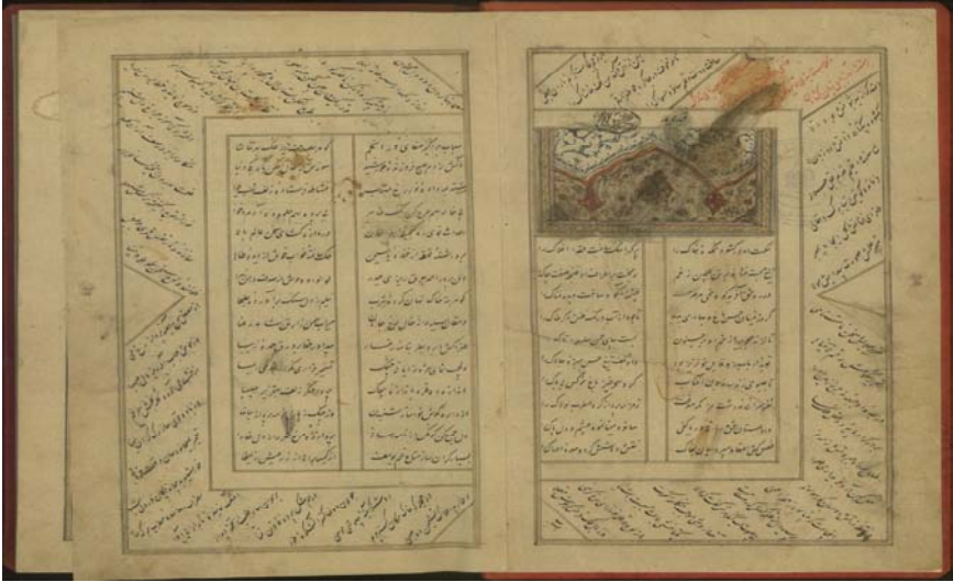
برگ آخر نسخه خطی دیوان طغرا (متعلق به کتابخانه مجلس شورای اسلامی)