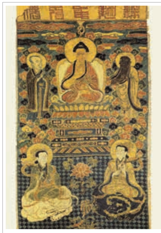
■ تصویر ۶: تانگ کا، بودای ساکیامونی به همراه منجوسری و سامانتا‌بهادر، قرن ۱۵ تا ۱۷ میلادی، ارتفاع ۶۹ سانتی متر

این آثار بودایی بر روی ابریشم تاکنون مربوط به دوره تانگ بودند؛ در اینجا دو نمونه از آثار بودایی را بر روی ابریشم در سلسله مینگ بررسی می‌کنیم. «گلیم بافته ۳۳ و قلاب‌دوزی‌های تانگ ۳۳ کا یا تصاویر بودا، در سلسله یوآن هم استفاده می‌شده است ولی در سلسله مینگ بهتر شناخته شده است و شامل تکه‌های با شکوهی از اوایل قرن پانزدهم میلادی می‌باشد. در طول سلسله مینگ طلا و زری‌بافی‌های پلی کرمی و قلاب‌دوزی برای تصاویر بودا استفاده می‌شده است که اغلب به نوبت بر روی زری‌دوزی‌ها و ساتن‌ها نصب می‌شد.» (همان منبع، ۱۴۹) در تصویر (۶)، «تانگ کا، بودای ساکیامونی که از دو طرف به وسیله منجوسری ۳۴ و سامانتا‌بهادر ۳۵ حفظ شده است، کشیده شده که به شیوه شماره دوزی دوخته شده است. کتیبه در بالای تصویر نوشته است: بودای ساکیامونی.» (همان، ۱۵۰) در این تصویر ترکیبی از رنگ قرمز و آبی غالب می‌باشد. بودا در حالت نشسته بوده و دو بودیساتوا بر روی شیر و فیل قرار گرفته‌اند و در میان آن‌ها گل‌لوتوس نیز بافته شده است. در اینجا ترکیبی از نقوش هندسی و غیرهندسی مشاهده می‌گردد.