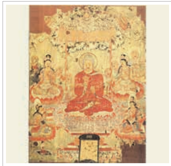
■ تصویر ۱. بودا آیین را فرا می‌آموزد، از غار ۱۷ دون هوانگ، اوایل قرن ۸، مرکب و رنگ روی ابریشم، ارتفاع ۱۳۹ سانتی‌متر

روی ابریشم است که بودا را در حالت موعظه تصویر می‌کند و مربوط به سلسله تانگ می‌باشد. «نقاشی، بودا را در حالت موعظه در زیر سایبانی تزئین شده نمایش می‌دهد. او در زیر درخت بودی ۲۳ نشسته است جایی که ساکیامونی ۲۴، بودای تاریخی، هنگامی که به روشننگری رسید نشسته بود.» (Michaelson & Portal, 2006, 37) در اینجا چهار بودیساتوا در اطراف بودا بر روی گل‌های لوتوس (نیلوفر) ۲۵ نشسته‌اند؛ شش رهرو نیز در آنجا مشاهده می‌شوند. در قسمت پایین «یک پیشکش آورنده زن دیده می‌شود که نقش همتای مرد او در سمت راست پاک شده و از آن فقط کلاهی بجا مانده است.» (فیشر، ۱۳۸۳، ۱۲۴) «قسمت عمودی پایین نقاشی هم با نام پیشکش آورندگان پر می‌شده اما در اینجا خالی است.» (Michaelson & Portal, 2006, 37) تصویر با سایه روشن‌های زیبا آراسته شده و رنگ قرمز تیره و روشن غالب است و این سایه پردازی‌ها به بعد تصویر افزوده‌اند. ابریشم ابتدا بر روی دستگاه بافندگی بافته شده و پس از آن، نقاشی با قلم مو و مرکب و رنگ بر روی آن صورت گرفته است و این پرده زیبا خلق شده است.