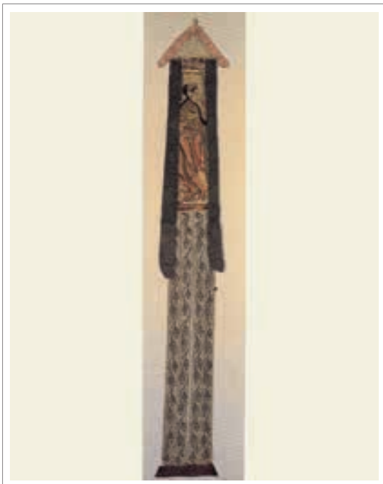
تصویر ۵: پرچم ابریشمی، اواخر قرن ۹ میلادی، ارتفاع ۱۷۲ سانتی‌متر

در تصویر (۵)، پرچمی ابریشمی را مشاهده می‌کنید که احتمالاً در معابد قرار داده می‌شده است. «به‌طور کلی هنر معبد در چین عمدتاً بودایی بوده است.» (همان منبع، ۳۲) «بر روی این پرچم، بودیساتوایی به تصویر کشیده شده است که یک کاسه شیشه‌ای حاوی گل لوتوس در دست دارد. نقاشی بر روی ابریشمی نازک کشیده شده است که تصویر آن از دو طرف قابل مشاهده می‌باشد. نوارهای آویخته پایینی هم نقاشی شده‌اند. در اینجا ابریشم به عنوان پشتیبانی برای تزیین استفاده شده تا بافتهای تزیینی.» (همان منبع، ۱۰۱)