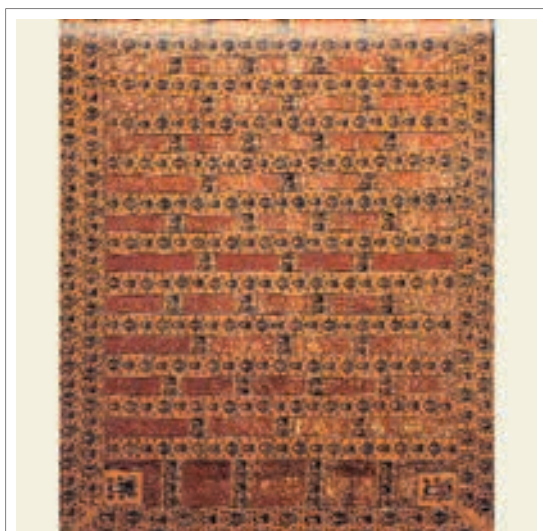
■ تصویر ۷: ردای کاهنان بودایی، اواخر قرن ۱۵، عرض ۳۰۹ سانتی متر، ارتفاع ۱۱۲ سانتی متر