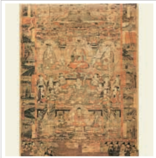
■ تصویر ۲. بهشت ساکیامونی، از غار دون هوانگ، سلسله تانگ، اوایل قرن ۹ میلادی، مرکب و رنگ روی ابریشم

می‌باشند؛ گروه زنان در سمت چپ و مردان در سمت راست قرار دارند. «سبک لباس‌ها و ترکیب منظره بهشت، ساده می‌باشد.» (همان منبع، ۳۸) در اینجا هم، رنگ غالب بر روی بافته ابریشمی قرمز است. بودا و بودیساتواها بر روی گل‌لوتوس مشاهده می‌شوند و در پشت و پس زمینه تصویر، نمایی از معماری چینی دیده می‌شود.