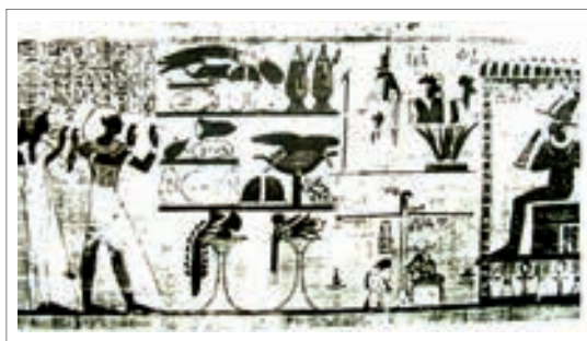
تصویر ۲۲: پاپیروس تختت همراه همسر خود در حال نیایش اوریزیس