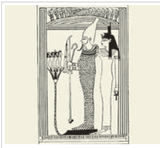
تصویر ۲۱: اوریزیس در کنار همسرش ایزیس

کلمه نفرتوم به معنای آتوم زیبا و جوان است. نفرتوم از خدایان کهن مصر سفلی است که از درون نیلوفر آبی و در دریای تیغ های مقدس هستی می یابد و به سبب پیوند نیلوفر آبی و خورشید او را رع جوان می نامند. پس از زاده شدن نفرتوم از نیلوفر آبی از اشک او بود که انسان پدید آمد. زندگی بخشی نفرتوم او را با نیلوفر آبی پیوند زده است. بر این اساس کاهنان هلیوپولیس از تمثیل نیلوفر آبی استفاده می کردند که بعدها خود نیلوفر، خدای نفرتوم شناخته شد. در موزه قاهره زیباترین تصویر از این مفهوم وجود دارد. (هارت، ۱۳۷۴، ۱۴) نفرتوم علاوه بر خدای خالق، خدای خوش شانس و خدای عطر نیز شناخته می شود. نفرتوم را با هیأت