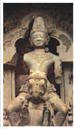
تصویر ۴ سوریا