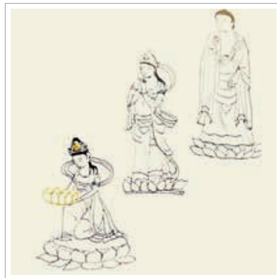
تصویر ۱۳: آوالوکیتشوارا همراه با آمیتابها

۱. همراه با آمیتابها در حالی ترسیم شده که بر روی گل نیلوفر آبی ایستاده و زائوزده تا بهشت غربی آمیتابها را حمل کند.