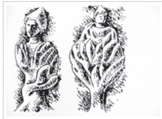
تصویر ۱: زایش مهر از میان نیلوفر

می‌دانستند و نیلوفر با آیین مهر پیوندی نزدیک دارد. بعضی از پژوهشگران معتقدند در صحنه زایش مهر، آن چیز که مانند میوه ی کاج است و مهر از آن بیرون می‌آید، غنچه نیلوفر است، نه صخره. (باحقی، ۱۳۷۸، ۴۲۹) گل نیلوفر ریشه در گل ولای آبیگیر دارد. گل آن قد می‌کشد تا در برابر نور بامدادی خورشید بر سطح آب بشکفتد. این ریشه در تاریکی‌ها داشتن و شور شکفتن در برابر نور، بدون تردید مورد توجه طرفداران آیین مهر قرار گرفته است. پرستش مهر که از قدیم مورد توجه آریایی‌های ایرانی بود در زمان اردشیر دوم قوت می‌گیرد و این موضوع نیز در زمان اردشیر سوم نیز ادامه پیدا می‌کند. عالی‌ترین نمونه تصویری در نقش نیلوفر میتراپی در این دوران به مراسم اعطای حلقه سلطنت به اردشیر دوم با حضور مهر در طاق بستان است که در زیر پای او نیلوفری شکفته حجاری شده است. همچنین آورده‌اند که در ایران در روز جشن مهرگان مانند نوروز، خوان چه ای آماده می‌کردند و در آن لیمو و شکر و نیلوفر و به و سیب و یک خوشه انگور سفید و هفت دانه مورد می‌گذاشتند و موبدان این خوان چه را واج گویان نزد شاه می‌بردند. (فره‌وشی ۱۳۶۴، ۹۲)