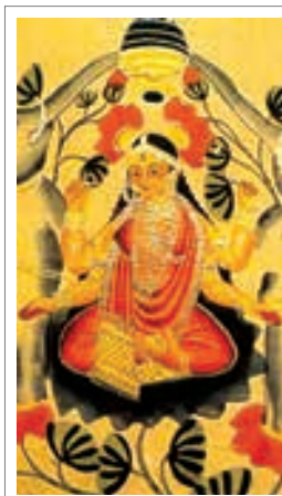
تصویر ۹: الهه لاکشمی نشسته بر گل نیلوفر آبی

باشد به عنوان نماد ثروت است و اگر به رنگ سفید باشد، نماد طبیعت است که در تمام جهان توسعه یافته و اگر به رنگ صورتی باشد مادر و خالق همه موجودات است. (Swami 1982, 24) در تجلی ویشنو به هیات کوتوله موسوم به (وامنه)، لاکشمی از آبها زاده می‌شود و بر گل نیلوفر آبی شناور می‌شود و بدین دلیل پادما(نیلوفر آبی) یا کامالا نام می‌گیرد. او به همراه همسرش در کنرا گل نیلوفر یا سوار بر گارودا است و وقتی به تنهایی نیایش می‌شود، در نقش نیروی مادینگی، موجودی برتر و چون (مادر جهان) مورد توجه قرار می‌گیرد. لاکشمی را اغلب ایستاده بر روی نیلوفری در میان فیلان، در حالی که بارانی از سکه‌های زر از دستانش می‌بارد نیز ترسیم می‌کنند. نقش او امروزه زینت بخش سکه‌های هندو است و دیوالی یا عید نور، هر ساله برای کمک خواهی از او برگزار می‌شود. (شاتوک، ۱۳۸۱، ۶۶)