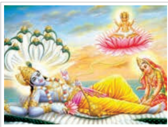
■ تصویر ۶ خدای ویشنو نشسته بر مار ششا

ویشنو برای نخستین بار در حجاری های گوپتا به طرز مصور شده است که بر روی آبها دراز کشیده و خفته است. تخت او عبارت است از یک مار هزار سر و از ناف ویشنو گل نیلوفری میروید که برهما بر آن نشسته است. (هال، ۱۳۸۳، ۱۹۵) ویشنو را معمولاً به شکل مرد جوانی با رنگ پوست آبی تیره و با چهار دست تجسم می کنند. (جلالی مقدم، ۱۳۸۰، ۳۵) در دستی صدف حلزون یا (سانکائی) دارد که روزگاری مأوای اهریمن بود که به دست کریشنا کشته شد و در دست دیگر اسلحه و صدف با حلقه های آهنین موسوم به سودار سانا که منسوب کریشنا است و توست آگنی به عنوان پاداش شکست به کریشنا هدیه می شود و در سومین دست او گرز است موسوم به کاونودا کیکه و در دست چهارم گل نیلوفر مظهر چرخش جهان هستی قرار دارد. چهار دست و چهار بازوی ویشنو اشاره به چهار جهت فضا فرمانروایی جهان دارد. مفهوم دیگر چهار بازو، چهار مرحله زندگی هندو یا چهار هدف زندگی است که به ترتیب شامل: زندگی دنیوی، خانوادگی، طلبگی و گوشه گیری از دنیا است. (شایگان، ۱۳۶۲، ۱۷۹)