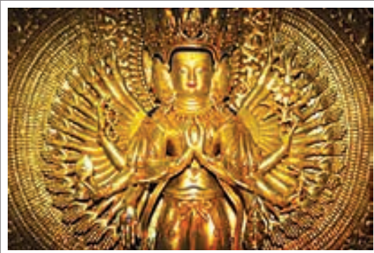
تصویر ۱۴: آوالوکیتشوارا با هزار دست

۴. آوالوکیتشوارا به صورت شاهزاده ای ملبس به جامه شاهانه که تاجی بلند بر سر دارد و در دست چپ خود شاخه گل نیلوفری سرخ رنگ گرفته است. (هال، ۱۳۸۳، ۳۲۲)