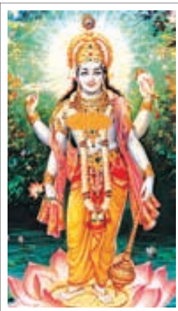
■ تصویر ۷: ویشنو ایستاده بر گل نیلوفر