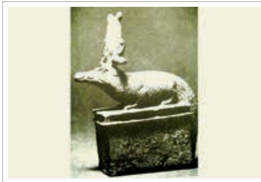
تصویر ۲۳: سبک به شکل تمساح

سبک تمساح خدای شهر باستانی مدینه التمساح از مناطق باستانی مصر سفلی در فیون بود. سبک خدای آب، موجب باروری و حاصلخیزی است. او در آغاز از خدایان فرودست و در التزام رع وظیفه او به دام انداختن چهار پسر هوروس در درون نیلوفر آبی در دریا بود. بدین ترتیب که چهار تن از فرزندان هوروس در شمار اعضای سومین مجموعه ایزدان نه گانه بودند و گمان می داشتند که از ایزس زاده شده اند. سبک به فرمان رع آنان را به دام انداخت و بر روی نیلوفر آبی ایستاد. سبک تا دوره فرمانروایی عصر متاخر خدایی ترسناک و به شکل تمساحی مومیایی شده و یا مردی با سر تمساح ترسیم می شد. (ایونس، ۱۳۸۵، ۱۴۰، ۱۴۱)