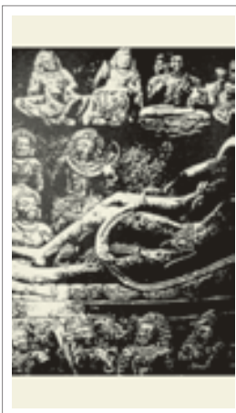
■ تصویر ۸: پیکره سنگی ویشنو معبد داست اوتارا، قرن ۷