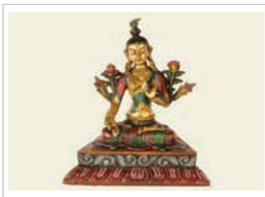
تصویر ۱۶: تارای سفید

او خدای مرگ مصریان و نماد تولد دوباره است. اوریزیس پس از آنکه به قتل رسید دوباره از نیلوفر آبی متولد شد، تصاویر او (تصویر ۲۱) شامل نمایش چهار خدای هوروس است که بر روی گل نیلوفر آبی در مقابل اوریزیس ایستاده‌اند. در کتاب مرگ تبدیل شدن یک فرد به نیلوفر آبی مترادف با رستاخیز و احیای اوست.