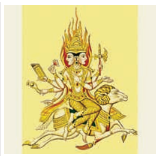
تصویر ۵ آگنی در دست خود گل نیلوفر آبی را حمل می‌کند

در نظر هندوها «آگنی» تخمی معنوی است که طبیعت و سرشت کلی انسان بر پایه آن رشد می‌یابد. بدین سبب آگنی در قربانگاه پنهان است چنانکه در قلب آدمی مخفی است و از آبهای آغازین یعنی مجموع امکانات بالقوه روح با جهان، زاده می‌شود و به همین جهت، گل نیلوفر آبی محمل آن است. (مددپور ۱۳۸۳، ۲۴۴) کوماراسوامی در کتاب عناصر شمایل نگاری بودایی به نقل از ریگ و دا ذکر می‌کند که آگنی نیز از نیلوفر آبی متولد شد و این ارتباط قوی بین آگنی و نیلوفر آبی سبب آن شد که در مرکز قربانگاه‌هایی که به نام آگنی ساخته می‌شد، گل نیلوفری قرار دهند. نیلوفر به دلیل جایگاه مقدس خود در معماری و هنر هندو متجلی شد و در معماری معابد، گل نیلوفر آبی بیانگر آگنی و سر بر آوردنش از آبهای آشفته نخستین بوده.