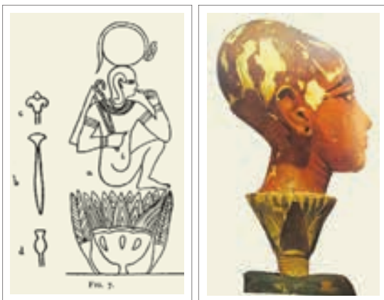
تصویر ۱۹ و ۲۰: زایش هوروس از گل نیلوفر

هوروس فرزند خورشید است که از درون شکوفه‌های نیلوفر آبی بیرون آمده است و به روایتی نیلوفر آبی به فرزند خورشید زندگی بخشید و با رایحه دل‌انگیز خود، زندگی بخش هر روز او بود. هوروس بر روی گل نیلوفر سفید می‌نشاند و خدای آفتاب می‌باشد.