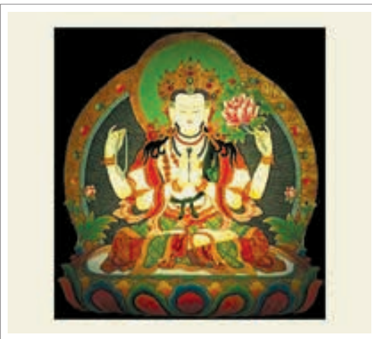
تصویر ۱۵: آوالوکیتشوارا با گل نیلوفری در دست