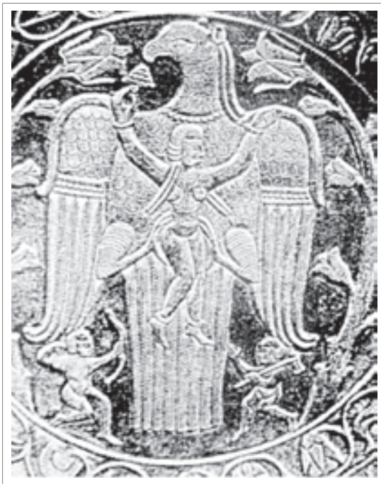
تصویر ۲ آن‌هایتا در پناه عقاب آسمان، اواخر ساسانی

مربوط به ۸۰۰ تا ۷۰۰ ق. م. است، نشانه‌هایی از آن‌هایتا به چشم می‌خورد. این ایزدبانو با صفات نیرومندی، زیبایی و خردمندی به صورت الهه عشق و باروری نیز در می‌آید. زیرا چشمه حیات از وجود او می‌جوشد و بدین گونه «مادر خدا» نیز می‌شود. تندیس‌های باروری را که به الهه مادر موسومند، تجسمی از این ایزدبانو می‌دانند. (آموزگار، ۱۳۷۴، ۲۱) در تصویر ۲ گل نیلوفر را در کنار ایزدبانوی مادر در اینجا «اشی» خواهر سروش نشان داده‌اند. تمام زنانی که می‌خواستند بارور شوند، تصویر این ایزدبانو را در حالی که در حال به دنیا آوردن نوزادی است روی صفحه مدوری از برنز یا طلا (یا به عنوان سنجاق) نشان می‌دادند و به عنوان نذر به عبادتگاه تقدیم می‌کردند.