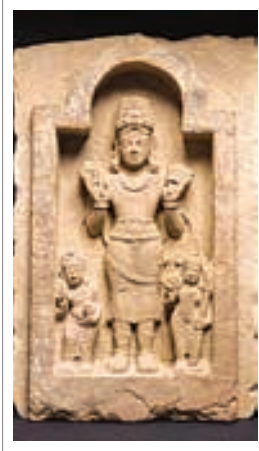
تصویر ۳ سوریا در معبد کارناک

نیلوفری بر فراز ارابه زرین خود می‌نشیند که توسط چهار یا هفت اسب مادیان کشیده می‌شود. (بلخاری قمی ۸۴) و همچنین نیلوفری را در هر یک از دستان خود گرفته است.