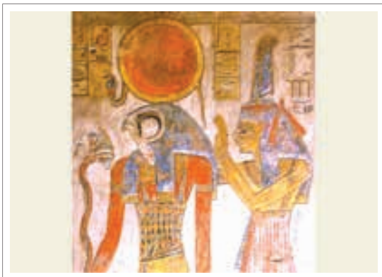
تصویر ۲۴: خدای رع

رع خدای تجسم خورشید در اوج قدرت و نام وی به معنای خورشید است در آغاز به نام اتوم، آفریننده هلیوپولیس که مرکز اصلی کیش وی بود نامیده می شد. او مشهورترین خدای تمام ادوار مصر است و بر اساس اسطوره آفرینش هرموپولیس از درون یک گل نیلوفر آبی که از آبهای دریاچه سر بر آورده بود به دنیا آمد. در این افسانه گل نیلوفر با خورشید یکی می شود و از آنجا که این گل روزها باز و شبها بسته می شود ارتباط آن با خدای خورشید که در میان پرچم های آن ماوا گزیده، عجیب نیست. پرستشگاه اصلی رع در هلیوپولیس بود و رع به صورت کودکی مصور شده که بر روی گل آرمیده است و یا سر او از گل نیلوفر بیرون می آید. از سلسله پنجم فراعنه خود را پسر رع می نامیدند. رع معمولا دارای جسم بشر و سر شاهین است و تاجی با قرص خورشید به علامت سلطنتی مصر بر سر دارد. (اباذری، ۱۳۷۲) بنا بر روایتی نیلوفر آبی از دریای دو تیغ سربر آورد و با گشوده شدن گلبرگ های نیلوفر درون جام گل رع به هیات کودکی نمایان شد. در این روایت نیلوفر آبی گاهی چشم رع و از بازو بسته شدن آن شب و روز پدیدار می شود. (ایونس، ۱۳۸۳، ۴۹، ۴۸)