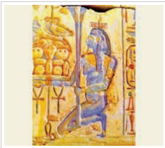
تصویر ۱۸: خدای هاپی

مردی با ریش آبی و سبز و دارای پستان زنانه و افتاده که نماد حاصلخیزی بود ترسیم می‌کردند. در این نقش‌ها دستار هاپی از گیاهان آبری غالباً پاپیروس و هنگامی که او را خدای رود نیل می‌نگاشتند با دستاری از نیلوفر آبی ترسیم شده است. (ایونس ۱۳۸۵، ۱۶۸، ۱۶۹، ۱۷۰)