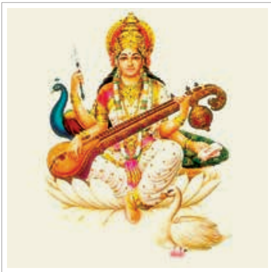
تصویر ۱۱: الهه ساراسواتی نشسته بر گل نیلوفر

(سوا) به معنی خود و شخص است. بنابراین ساراسواتی به معنی گوهر و ذات هر شخص است. ساراسواتی در اساطیر هندو به عنوان همسر برهما، خالق جهان ظاهر می‌شود و دانش او برای خلق لازم و ضروری است بنابراین او سمبل نیروی خلاق برهما نیز هست. در اساطیر هند و ایرانی در آیین ودایی، ایزدبانوی ساراسواتی، صفاتش همانند آنهیتای ایرانی است. در آیین ودایی ایزدبانوی ساراسواتی را با چهره ای سپید و اندامی برازنده و زیبا که نیم تاجی به شکل ماه بر سر دارد و بر روی گل نیلوفر نشسته است تصویر نموده‌اند.