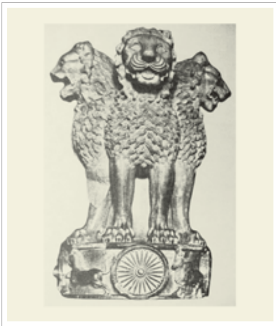
■ تصویر ۳: سر ستون سارانات، دوره آشوکا، ۱۵۰/۲ متر، ۲۵۰ ق. م.

نوع دیگری از معماری بودایی معابدی به نام استوپا ۱۱ است. استوپا بنایی توپر به شکل نیمکره است که از جنس خاک، آجر یا سنگ ساخته شده و در مرکز آن بقایای خاکستر بودا و قدیسین قرار دارد. ۱۲ الگوی این شکل از معماری برگرفته از گورتل های هندو است. بر فراز استوپا میله‌ای قرار می‌گیرد که «یاستی» نامیده شده و با صفحاتی گرد یا چترواره ۱۳ مزین می‌شود. حصار مربع شکل به نام «هارمیکا» ۱۴ اطراف یاستی را در بر می‌گیرد. استوپا با نرده‌ای از اطراف خود جدا می‌شود. از آنجا که استوپا حجمی توپر است و امکان ورود به آن وجود ندارد، نیایشگران در جهت عقربه‌های ساعت در اطراف آن طواف می‌کنند. استوپای «سانچی» ۱۵ بیش از سایر استوپاها معروف بوده و در قرن اول قبل از میلاد در هند بنا شد. (تصاویر ۴ و ۵)