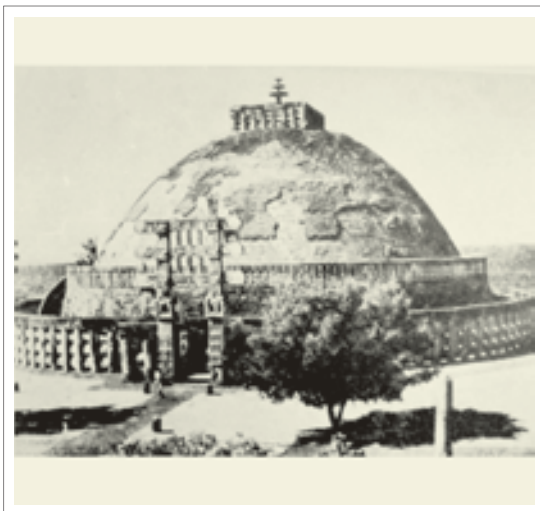
■ تصویر ۴: استوپای سانچی، قرن اول ق. م.

نوع دیگری از معماری بودایی معابدی به نام استوپا ۱۱ است. استوپا بنایی توپر به شکل نیمکره است که از جنس خاک، آجر یا سنگ ساخته شده و در مرکز آن بقایای خاکستر بودا و قدیسین قرار دارد. ۱۲ الگوی این شکل از معماری برگرفته از گورتل های هندو است. بر فراز استوپا میله‌ای قرار می‌گیرد که «یاستی» نامیده شده و با صفحاتی گرد یا چترواره ۱۳ مزین می‌شود. حصار مربع شکل به نام «هارمیکا» ۱۴ اطراف یاستی را در بر می‌گیرد. استوپا با نرده‌ای از اطراف خود جدا می‌شود. از آنجا که استوپا حجمی توپر است و امکان ورود به آن وجود ندارد، نیایشگران در جهت عقربه‌های ساعت در اطراف آن طواف می‌کنند. استوپای «سانچی» ۱۵ بیش از سایر استوپاها معروف بوده و در قرن اول قبل از میلاد در هند بنا شد. (تصاویر ۴ و ۵)