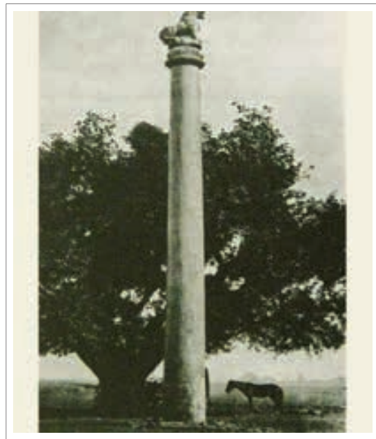
■ تصویر ۲: ستون آشوکا با سرستون شیر، در منطقه لوریانا ندانگره، ۲۴۲ ق. م.

این ستون‌ها که از جنبه هنری بسیار قابل توجه هستند مشتمل بر سرستون‌هایی بودند که در آن‌ها نمادهای بودایی چون گاو، شیر، چرخ، اسب و گل نیلوفر به کار رفته بود. ستون «سارانات» ۱۷ معروف‌ترین این ستون‌ها است که در محل اولین موعظه بودا - پس از دستیابی به نیروانا- برافراشته شد. (تصاویر ۲ و ۳)