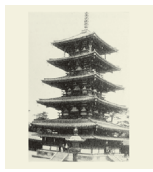
تصویر ۶: پاگودای هوریوجی، ژاپن، قرن هفتم م.

پاگودا ۱۶ نوع دیگری از معماری بودایی است که متأثر استوپا ساخته شده اما شکل آن چندان وجه مشترکی با استوپا ندارد. پاگودا معبد هرمی شکل است که بر روی بقایا و یادگارهای قدیسین بنا می شود. پاگودا از چند طبقه تشکیل شده و شکل آن در جهت بالا باریک تر می شود. این نوع بنا بیشتر در مناطق خارج از هند همچون چین، ژاپن و کره دیده می شود. (تصویر ۶)