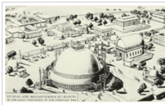
تصویر ۵: ترسیم بازسازی مجموعه سانچی.

فیشر معتقد است که استفاده از میله بر فراز استوپا اشاره به «محور عالم» در دیدگاه کیهان شناسی بودایی دارد