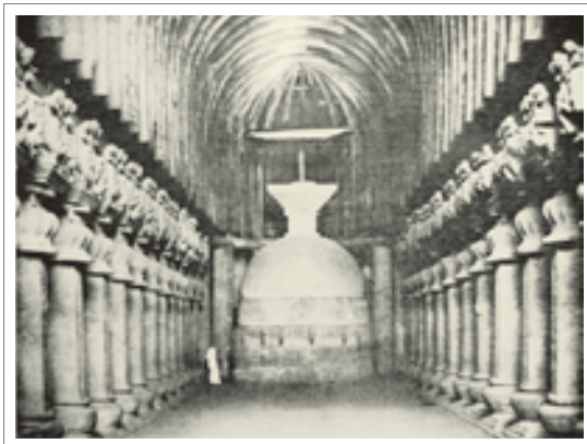
تصویر ۷: چایتیای کارلی، قرن اول م.

شکل دیگری از معابد بودایی چایتیا ۱۷ نام دارد. چایتیا معبدی است که برای عبادت و نیایش بوداییان در دل کوه ها و صخره ها ساخته می شود. فضای آن به شکل U بوده و سقف آن از نوع گهواره ای است. در دو طرف چایتیا دو ردیف ستون وجود دارد و در انتهای آن یک استوپا قرار داده می شده که بوداییان می توانستند در اطراف آن طواف کنند. (تصاویر ۷ و ۸)