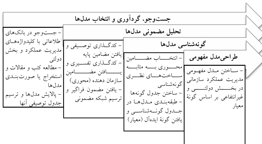
نمودار ۱. فرآیند پژوهش به منظور دستیابی به مدل مفهومی مدیریت عملکرد سازمانی در بخش دولتی

گام نهایی تحقیق، طراحی مدل مفهومی مدیریت عملکرد سازمانی برای سازمان‌های دولتی و غیرانتفاعی است که در پی بحث تحلیلی درباره مدل‌های مختلف و بر اساس گونه ایده‌آل، عرضه می‌شود. در واقع، گونه ایده‌آل شناخته‌شده، پشتوانه نظری مدل پیشنهادی محققان خواهد بود.