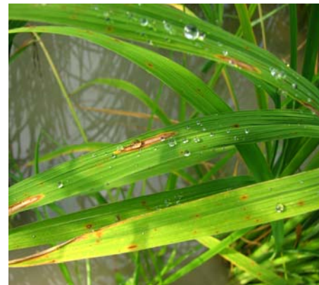
شکل ۲- نمایش لکه‌های دوکی شکل حساسیت (بالا) مربوط به والد مادری و لکه‌های کوچک میلی‌متری مقاومت (پائین) مربوط به لاینهای اصلاح شده.

در نتیجه این پژوهش دو ژن مقاوم به بلاست برنج (Pi-1 و Pi-2) به رقم حساس طارم دیلمانی منتقل شدند. رقم ترمیم شده طارم دیلمانی در مقابل جدایه‌های قارچ عامل بلاست در منطقه مقاومت نشان داد. تیپ آلودگی درجه ۴ و ۵ (حساسیت) که قبل از انجام پژوهش وجود داشت به تیپ آلودگی درجه ۱ و ۲ (مقاومت) تبدیل شد. مورفولوژی گیاه و کیفیت آن تغییر جزئی نمود اما