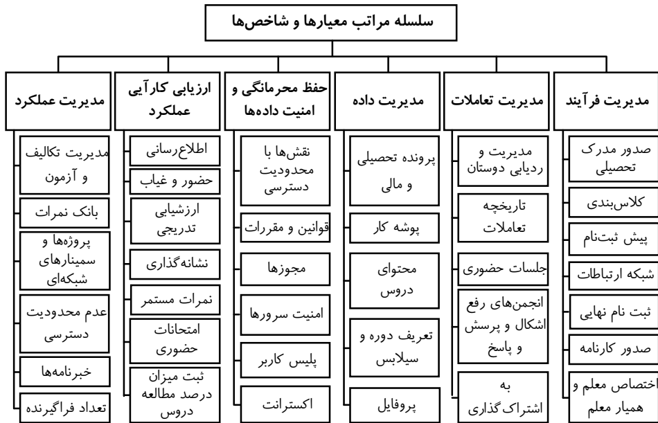
شکل ۲. سلسله‌مراتب معیارها و شاخص‌های ابزارهای آموزشی با رویکرد شبکه‌های اجتماعی

تعاملات موجود در شبکه مدارس و مدیریت فرآیندهای موجود در شبکه دانش و شبکه اجتماعی و شبکه مدارس دانش‌آموزان، مربیان و مدیران مدارس می‌باشد. ۲. طراحی ساختار سلسله‌مراتبی: در این مرحله از پژوهش، سلسله‌مراتبی از هدف، معیارها و زیرمعیارها طراحی شد. لازم به ذکر است به منظور ساده‌سازی انجام مراحل تحقیق، ساختار سلسله‌مراتب مورد نظر تا زیرمعیارها (شاخص‌ها) گسترش داده شد و از بیان گزینه‌ها صرف نظر می‌گردد. شکل ۲، ساختار سلسله‌مراتب مؤلفه‌های طراحی ابزارهای آموزشی در مدارس با رویکرد شبکه اجتماعی را نمایش می‌دهد.