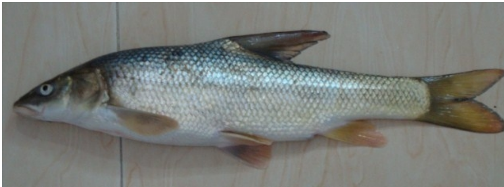
شکل 1: ماهی برزم ( Barbus pectoralis ) صید شده در مطالعه حاضر، بهار 1390