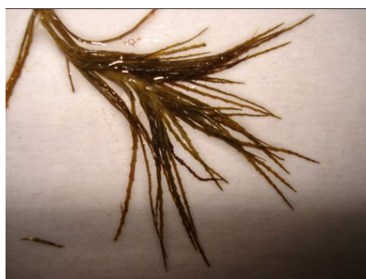
شکل ۵: گونه رکورد Najas gracillima در سال ۱۳۸۶-۱۳۸۹