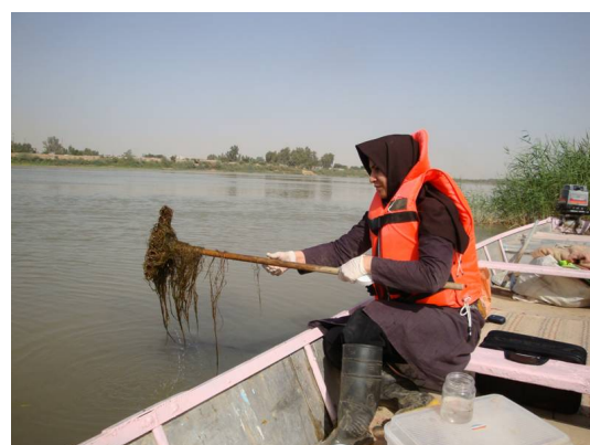
شکل ۱: جمع آوری نمونه از رودخانه کارون اهواز