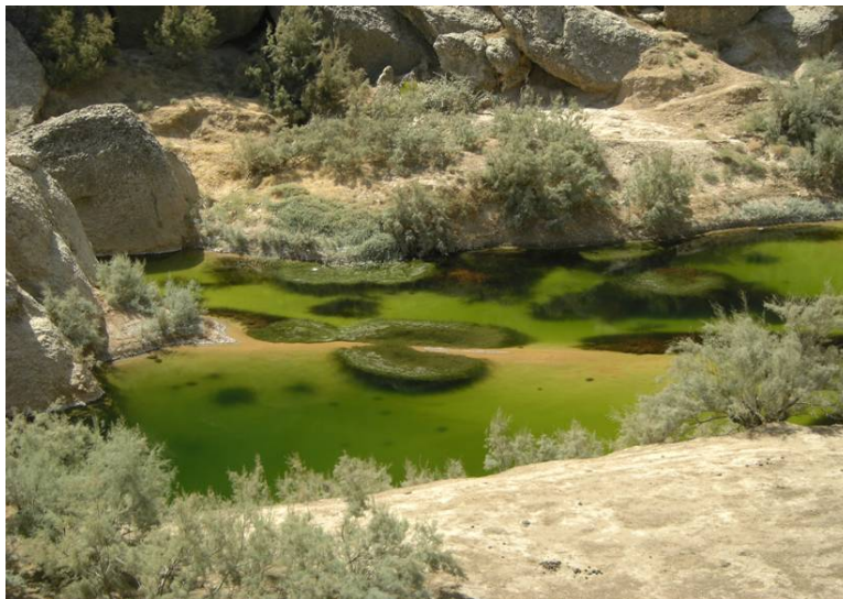
شکل ۳: رویشگاه گونه رکورد Ruppia cirrhosa ، ماندابی در اطراف اندیکا سال ۱۳۸۹-۱۳۸۶