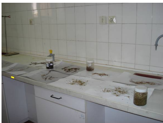
شکل ۲: نگهداری نمونه های گیاهی آبی به شکل فیکس شده و هرباریومی

در این تحقیق ضمن پیمایش صحرایی، نمونه های گیاهی از تالاب های مختلف کشور جمع آوری (شکل ۱) و پس از شستشو در آزمایشگاه به دو شکل فیکس شده در فرمالدئید ۶ درصد و نمونه هرباریومی در مرکز تحقیقات کشاورزی و منابع طبیعی خوزستان نگهداری و یک نمونه به هرباریوم ملی موسسه تحقیقات جنگلها و مراتع کشور ارسال شد (شکل ۲). برای شناسایی نمونه های جمع آوری شده از فلور ایرانیکا (Dandy, 1971; Riedl, 1976) و فلور تیره های آبی کشورهای همسایه و با کشورهای با اقلیم مشابه مانند فلور ترکیه (Uotila, 1984)، روسیه (Komorov, 1934; Yuzepchuk, 1968)، عراق (Dandy, 1980)، پاکستان (Hashmi and Omar, 1986)، فلسطین (Feinbrun-Dothan, 1986) و شرق (Boissier, 1881) استفاده شد. برخی گونه های آبی جهان بومی هستند که در این موارد فلور کشورهای اروپایی (Dandy, 1980) و آمریکایی (موجود در وب سایت، www.efloras.org ) نیز مورد استفاده قرار گرفت. برای بررسی صفات کمی و کیفی ظاهری گیاهان جمع آوری شده جداولی به این منظور تهیه گردید که شامل ویژگی های مربوط به ریشه، ساقه، برگ، گل و گل آذین بود. برای تکمیل مطالعات نمونه های گیاهی هرباریوم های ملی موجود داخلی (هرباریوم موسسه تحقیقات جنگلها و مراتع کشور، دانشگاه تهران و موسسه گیاهپزشکی کشور) نیز شناسایی و بازنگری شد.