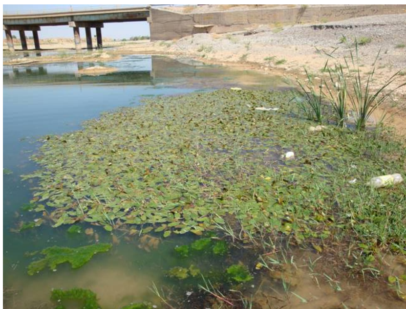
شکل ۶: گونه برگ شناور Potamogeton nodosus در رودخانه دز، سال ۱۳۸۶-۱۳۸۹