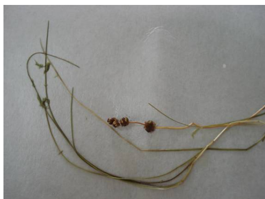
شکل ۴: گونه رکورد Potamogeton filiformis در سال ۱۳۸۶-۱۳۸۹