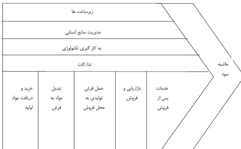
شکل ۲ زنجیره ارزش فرش

۲ - فعالیت‌های پشتیبانی: فعالیت‌های پشتیبانی آن دسته از فعالیت‌هایی هستند که حول فعالیت‌های اصلی و برای آماده‌سازی شرایط اجرای آن‌ها انجام می‌شوند. با توجه به مطالب گفته شده می‌توان زنجیره ارزش صنعت فرش را به شرح زیر بیان نمود: