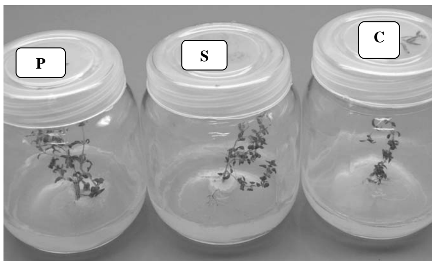
شکل شماره ۲- تأثیر قارچ‌های P. indica و S. vermifera روی رشد گیاه آویشن ( T. vulgaris ) در شرایط درون شیشه‌ای. (P = Piriformospora indica , S = Sebacina vermifera and C = control)