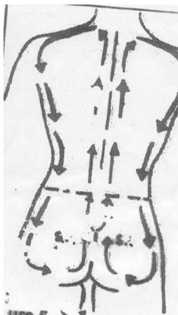
تصویر شماره ۲- آروماتراپی ماساژی سر تا سر پشت

در طی افلوراج فشار آرام بر پوست وارد شده و این فشار به میزان متوسط به لایه زیرجلدی منتقل می‌شود. فشار در طی این روش آنقدر عمیق نیست که نسوج زیرین را تحت تأثیر قرار دهد. کیفیت فشار، سرعت و ریتم آن ممکن است باعث ایجاد اثرات مختلفی بشود. برای مثال وقتی افلوراج با فشار متوسط، آهسته و آرام در پشت انجام شود، می‌تواند سیستم پاراسمپاتیک را تحریک نماید و پاسخ آرام‌سازی ایجاد شود و وقتی فشار متوسط تا عمیق باشد می‌تواند باعث افزایش بازگشت وریدی در اندام‌ها شود [۲۱،۲۲].