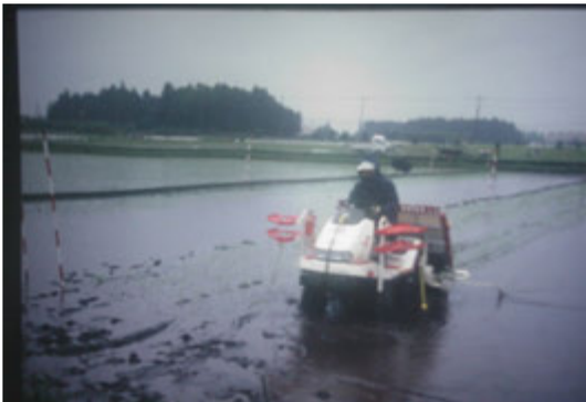
شکل ۲: ماشین نشاکار سوارشونده چهار ردیفه

این پژوهش در حوزه آبریز هراز اجرا شد. مساحت هر قطعه کرت ۳۶۰ مترمربع به طول ۱۰۰ و عرض ۳/۶ متر بود. برای این منظور از آزمایش فاکتوریل در قالب طرح بلوک کامل تصادفی با دو عامل ماشین و سه سطح پادلینگ در چهار تکرار استفاده شد. در این طرح عامل اول، نشاکار سوارشونده و راه‌رونده و عامل دوم، پادلینگ به دفعات یک، سه و پنج بار (یک در