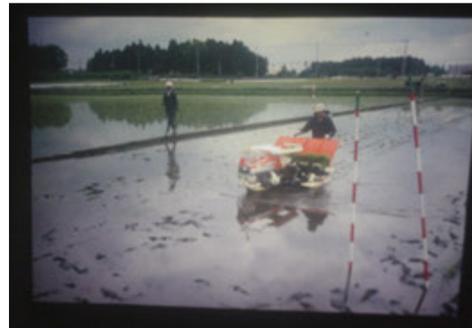
شکل ۱: ماشین نشاکار راه‌رونده چهار ردیفه

مقدار سوخت مصرفی با استفاده از سیلندر مدرج تعیین شد. در آغاز هر آزمایش مخزن سوخت نشاکار تا خط تراز پر شده، سپس در پایان عملیات نشاکاری هر کرت، با استفاده از سیلندر مدرج مجدداً آن را تا خط تراز پر و مقدار سوخت مصرفی اندازه‌گیری، ثبت و بر حسب لیتر در هکتار محاسبه گردید.