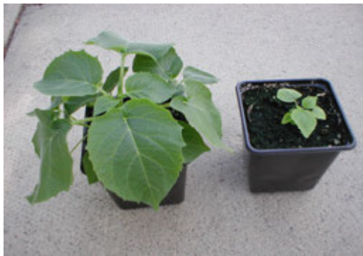
شکل ۱. علائم آلودگی در گیاه عروسک پشت پرده آلوده به PLRV شامل کوتولگی شدید و کلروز بین رگبری می‌باشد. گیاه آلوده (تصویر سمت راست) در مقایسه با گیاه سالم (سمت چپ)

سالم توسط هر ژنوتیپ شته تلقیح گردید و پس از اتمام دوره تلقیح شته‌ها به وسیله تدخین نیکوتین کشته شدند. سه هفته بعد از آزمایش تعداد گیاهان آلوده در گیاهچه-های تلقیح شده بر مبنای علایم (شکل ۱) یا نتایج آزمون الایزا تعیین گردید. ارزیابی آماری داده‌های مربوط به آزمایش‌های انتقال PLRV (درصد انتقال) با استفاده از مدل خطی عمومی توزیع دو جمله‌ای و رابطه لگاریتمی (logit link function) (مک کولاج و نلدر، ۱۹۸۹) انجام شد.