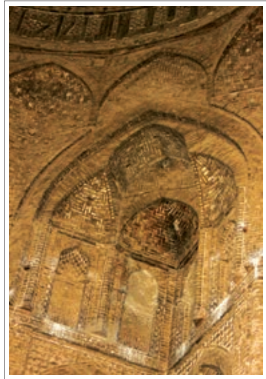
■ تصویر ۹: تزئینات پتکانه

دور تا دور ساقه گنبد کتیبه‌ای به خط کوفی ساده آجری برجسته می‌باشد که همچون کمربندی امتداد یافته است. متن کتیبه با بسم الله الرحمن الرحیم شروع می‌شود و با آیه ۵۴ سوره اعراف و نام بانی ساختمان، ابوالغنائم مرزبان ابن خسرو فیروز شیرازی (ملقب به تاج‌الملک) ادامه می‌یابد و در پایان سال ۴۸۱ هجری را نشان می‌دهد. (منرفر، ۱۳۵۰، ۷۷) متن به شرح زیر است: «بسم الله الرحمن الرحیم ان ربکم الله الذی خلق السموات و الارض فی سته ایام ثم استوی ... امر ببناء هذه القبة ابوالغنائم المرزبان بن خسرو فیروزختم الله بالخیر فی شهر سنه احدی و ثمانین و اربع مائه.» در بالا و پایین این کتیبه دونوارکه دارای تزئینات آجری می‌باشند قرار گرفته است. در زیر این کتیبه در ۳۲ پشت بغل موجود است که در هر یک از آنها دو کلمه به خط کوفی ساده با آجر به صورت برجسته اسامی و القاب خداوند نوشته شده است. (همان ۷۸، ۷۹) که به شرح زیر می‌باشد: