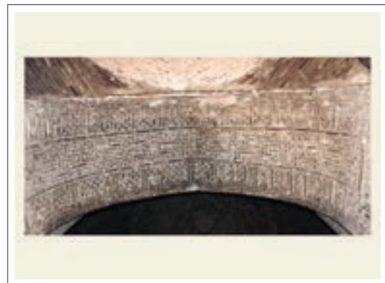
تصویر ۲: کتیبه هلال ورودی کتبخانه

در قسمت ورودی اصلی به این بنا و در ضلع جنوبی گنبد خانه، در قسمت حاشیه هلال، خط کوفی ساده آجری به صورت برجسته دور تا دور هلال را پوشانده و در وسط آن فرم‌های هندسی آجری همراه با بندکشی‌های بسیار جذاب اجرا گردیده است. متن از سمت غرب و پایین قوس شروع می‌شود و شامل آیات ۲۶ و ۲۷ سوره آل عمران می‌باشد. (هنرفر، ۱۳۵۰، ۷۸) این کتیبه بسیار دقیق و با مهارت خاصی اجرا شده و تمام قوس را پوشانده است. «خواندن متن که از آیات قرآن می‌باشد بیننده را کمک می‌کند تا بیشتر در فضای معنوی مسجد قرار گیرد». (حلیمی، ۱۳۹۰، ۲۲۴)