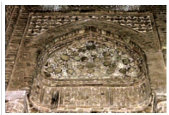
تصویر ۸: تزئینات قسمت جنوب شرقی

در قسمت شمال غربی و در بالای کتیبه تزئینات بسیار ظریف و ریز به شکل چند ضلعی‌های منظم و نامنظم اجرا شده است که از لحاظ ظرافت بسیار، شبیه نقوش خاتم‌کاری می‌باشد. در بخش بالاتر با ستاره‌های ۶ پر برجسته که در وسط آنها نیز نقوش ساده گچی طراحی شده، زینت یافته که مجدداً شاهد تکرار این ستاره‌ها می‌باشیم.