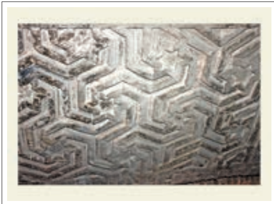
تصویر ۴: تزئینات ورودی شرقی برپایه ستاره شش وجهی

در بخش ورودی شرقی تزئینات زیبای آجری بر پایه ستاره شش وجهی (شمسه شش و پیلی) می‌باشد که دارای جلوه‌های پویا و چرخشی است که بر اثر تکرار و پیوند ستاره‌ها در یکدیگر، بافت شکل هندسی زیبایی ایجاد کرده است. که با نمودی آستره هندسی و کاملاً تجسمی موجب شده که ماده ساختمانی به نظر نیاید و با واسطه آن سیر در عالم زیبایی ناب هندسه فراهم آید. این طرح بسیار متفاوت و تأمل برانگیز است و «هنرمند با کمترین امکانات مادی، خالص‌ترین اثر هنری فرازمان و فرامکان را بوجود آورده است». (همان، ۲۲۹)