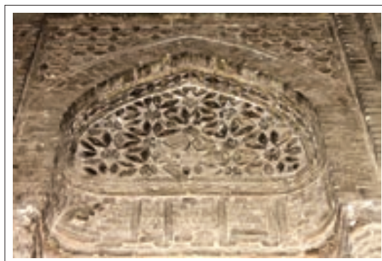
تصویر ۵: تزئینات قسمت جنوب غربی

در قسمت جنوب شرقی یکی از طاق‌نماها نقوش تفکیک شده برجسته دارد و قسمت دیگری که روی ضلع جنوبی منطبق است دارای نقوش ستاره مانند برجسته منظم و نامنظم می‌باشد که به تناوب تکرار شده است. در بخش بالاتر اشکال هندسی لوزی ماندنی طراحی شده که به گونه عمود روی هم نصب شده‌اند و تداعی کننده بافت یا شبکه حصیری می‌باشند.