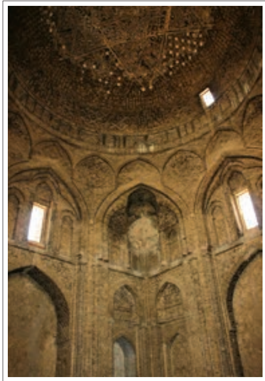
تصویر ۱: فضای کتبخانه شمالی

قسمت مربع پایین بنا دارای دوازده طاق نما می‌باشد که پنج تاي آنها باز و نقش ورودی بنا را ایفا می‌کنند و به جنوب و شرق راه دارند. هر یک از این طاق نماها را دو ستون مدور کوچک در دو طرف احاطه کرده است که از لحاظ چینش آجرها زیبا می‌باشد. این ستونها از آجرهای کوچک برجسته پوشیده شده که لابلای آنها قطعه های گچبری شده با نقش ضربدرکار شده است. در قسمت بالای شش طاق نماي کشیده، کتیبه به خط کوفی ساده آجری برجسته اجرا گردیده، که بعد از جمله بسم الله الرحمن الرحيم ، آیه ۷۸ و ۷۹ سوره اسری به ترتیب از ضلع جنوب غربی نوشته شده است. (هنرفر، ۱۳۵۰، ۷۸) وجود آیات قرآنی در اینجا باعث