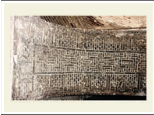
تصویر ۳: کتیبه خط کوفی آجری

در بخش ورودی شرقی تزئینات زیبای آجری بر پایه ستاره شش وجهی (شمسه شش و پیلی) می‌باشد که دارای جلوه‌های پویا و چرخشی است که بر اثر تکرار و پیوند ستاره‌ها در یکدیگر، بافت شکل هندسی زیبایی ایجاد کرده است. که با نمودی آستره هندسی و کاملاً تجسمی موجب شده که ماده ساختمانی به نظر نیاید و با واسطه آن سیر در عالم زیبایی ناب هندسه فراهم آید. این طرح بسیار متفاوت و تأمل برانگیز است و «هنرمند با کمترین امکانات مادی، خالص‌ترین اثر هنری فرازمان و فرامکان را بوجود آورده است». (همان، ۲۲۹)