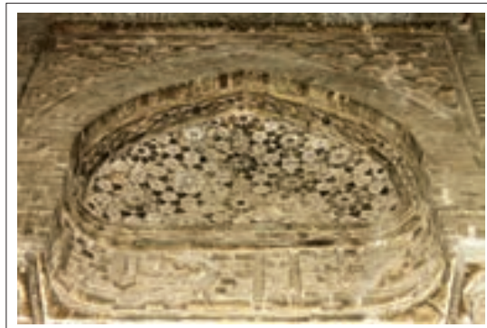
تصویر ۶: تزئینات قسمت شمال غربی

در قسمت هشت ضلعی بالا که هر ضلع دارای چند قسمت می‌باشد از تزئینات آجری و مهرهای گچی استفاده شده است. پتکانه‌ها دارای چهار طاق‌نما و مقرنسهای درشت می‌باشند که با چینش آجر به صورت عمود بر هم اجرا شده‌اند که علی‌رغم سادگی طرح بسیار جذاب و چشم‌نواز می‌باشند. در قسمت‌های وسط هم دارای سه طاق‌نما می‌باشد که ضلع میانی به عنوان نورگیر و تهویه هوا عمل می‌کند.