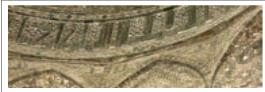
■ تصویر ۱۰: کتیبه ساقه گنبد و اسما الهی

تکرار اسما مقدس الهی و آیات قرآن بر تقدس این مکان می‌افزاید و بیش از هرچیز آنرا به مکانی روحانی و معنوی تبدیل می‌کند و مکانی را خلق می‌کند که سرتاسر معناست و تاکید بیشتری بر این عبادتگاه می‌کند.