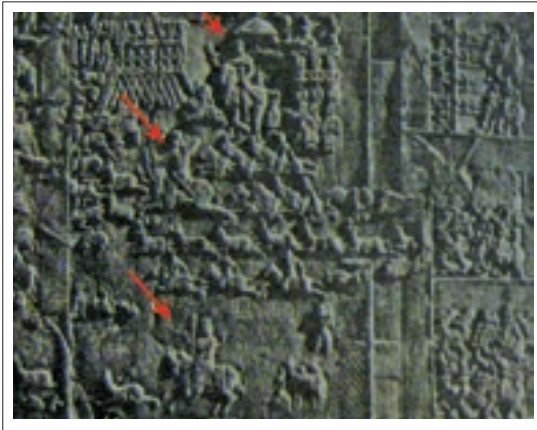
تصویر ۹: صحنه شکار گوزن، حجاری های طاق بستان (کریستین سن، ۱۲۸۰، ۲۲۵)

در صحنه شکار گوزن هنرمند حجار، شاه را در سه حالت (تصویر ۹) و در صحنه شکارگراز او را در دو حالت نقش کرده است (تصویر ۸) و در هر دو صحنه با این عمل خواسته به نوعی حرکت را تداعی کند، یعنی نوع تصویرگری، رمزگان های خاص را مشخص می کند.