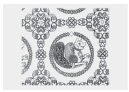
تصویر ۵: جزئیات نقش سیمرغ بر شلوار شاه سوار بر اسب در زیر زره (ریاضی، ۱۳۸۲، ۱۴۵)

لباس شاه دارای یک جفت سیمرغ متقارن بزرگ است که به نظر می‌رسد این سیمرغ‌ها روی نقوش گل چهارپری گلدوزی شده باشند. (تصویر ۳) در صحنه دوم خسرو پرویز سوار بر اسب خود، شب‌دیز است و نقش سیمرغ از زیر زره او پیداست. (تصویر ۴) با مقایسه طرح سیمرغ قلبی و طرح سیمرغ شلوار در می‌یابیم که نقش سیمرغ‌های شلوار شاه ظریف‌تر و پیچیده‌تر از نقش اول است. نقش سیمرغ بر روی