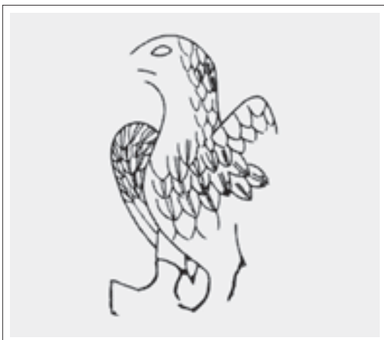
تصویر ۷: بزرگ‌نمایی نقش عقاب بر لباس شاه (ریاضی، ۱۳۸۲، ۱۷۱)