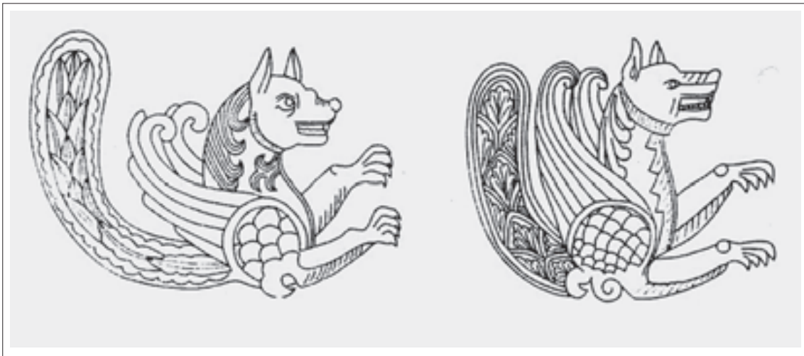
تصویر ۲: جزئیات نقش سیمرغ بر لباس شاه در دو قایق (ریاضی، ۱۳۸۲، ۱۳۰)

شلوار در دواير متوالی و به صورت زیگزاگ است. حد فاصل سیمرغ‌ها را گل‌های ترکیبی که نقش فرعی‌تری دارند تشکیل می‌دهند. طرح آن گل چهارپری است که روی چهارگلبرگ آن با گلبرگ‌های قلبی شکل که سه‌تایی هستند تزئین شده است. (تصویر ۵) سومین صحنه شکار گوزن است که درست مقابل صحنه شکارگراز قرار گرفته است و بر روی شلوار شاه نقش یک جفت عقاب روبروی یکدیگر ترسیم شده است. (تصاویر ۷، ۶)