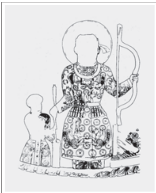
■ تصویر ۲: شاه در لباس مزین به نقش سیمرغ در پایان شکار گراز (ریاضی، ۱۳۸۲: ۵۹)

در نیمه دوم قرن سوم میلادی پس از یک دوره فترت در حیات اقتصادی ایران، دولت تازه تأسیس ساسانی با آگاهی