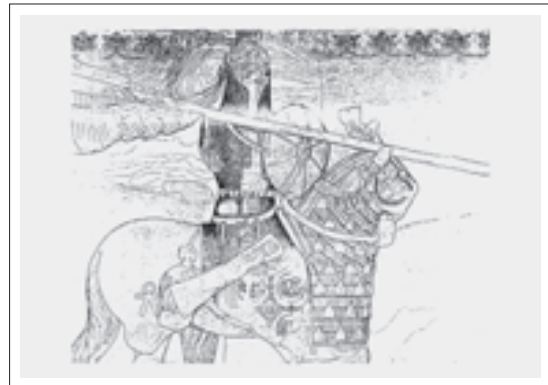
تصویر ۴: شلوار شاه سوار بر اسب در زیر زره (ریاضی، ۱۳۸۲، ۵۴)