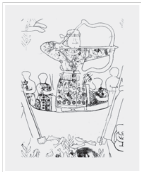
■ تصویر ۱: شاه در لباس مزین به نقش سیمرغ در حال شکار گراز (ریاضی، ۱۳۸۲: ۵۹)