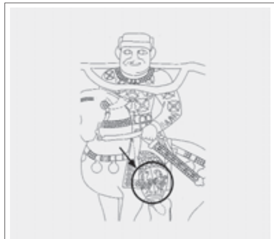
تصویر ۶: نقش لباس خسرو پرویز در صحنه شکار گوزن، طاق بستان (ریاضی، ۱۳۸۲، ۱۷۰)