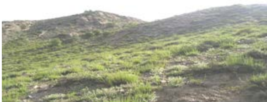
شکل ۵ - جامعه Artemisietum chamamelifoliae

شاخص آن با جامعه اصلی (رولوه ۳) به همین دلیل، به صورت یک زیر جامعه در نظر گرفته شده است. از گونه‌های تمایزی این جامعه می‌توان از گونه‌های Astragalus sp. ، Artemisia spicigera ، Stipa barbata نام برد. از گونه‌های همراه آن: Lapula microcarpa ، Krasheninkovia ceratoides ، Festuca ovina .