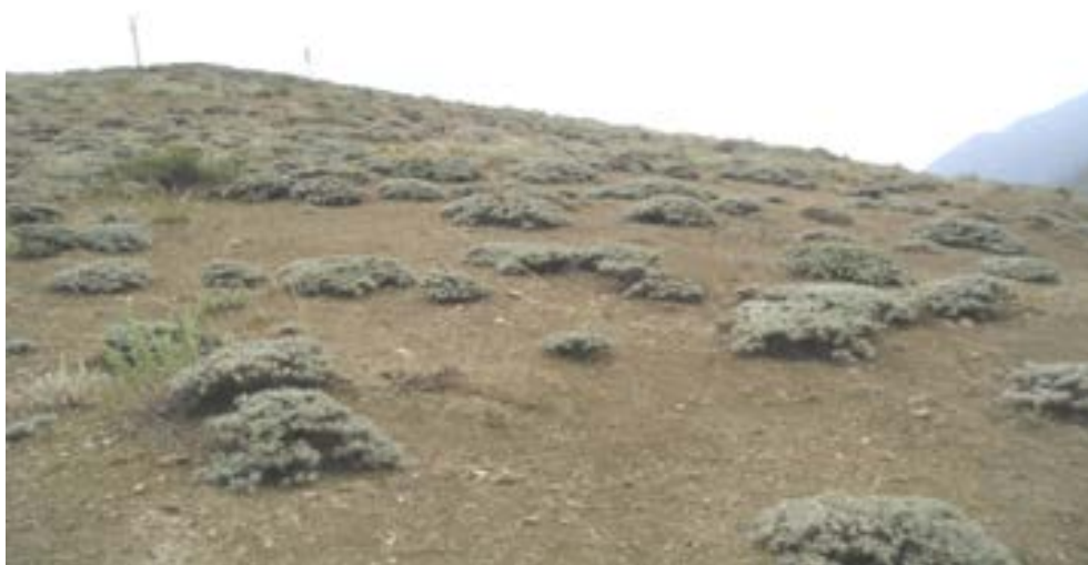
شکل ۴- جامعه Astragaletum denudatae

این جامعه (رولوه‌های ۴ و ۷) روی خاک‌های آنتی سل با شرایط ادافیکی خاص به‌ویژه نوع بافت که ماسه‌ای و ناپایدار و ضعیف است، از جامعه‌ی قبلی متمایز است. وجود گونه‌های خاردار و غالب Astragalus dendroides آن را از بقیه‌ی جوامع متمایز می‌سازد. شیب این زیستگاه به‌طور معمول ۵۰ تا ۶۰ درصد است و در دو طرف جاده دیده