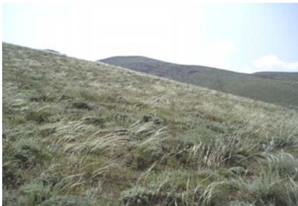
شکل ۶- زیر جامعه Artemisetosum spicigerae

۳-۱- زیر جامعه Artemisetosum spicigerae استقرار این واحد رویشی در زیستگاه‌های خشک‌تر و خاک نسبتاً عمیق‌تر (در مقایسه با جامعه Artemisietum chameamelifoliae در جهات جغرافیای مختلف با شیب نسبتاً کم ۳۰-۴۰ درصد با غلبه Artemisia spicigera رخ می‌دهد (رولوه ۶). اما گونه‌های شاخص آن به‌حدی نیست که به صورت یک جامعه مستقل در نظر گرفته شود. به همین دلیل، با توجه به شباهت برخی از گونه‌های