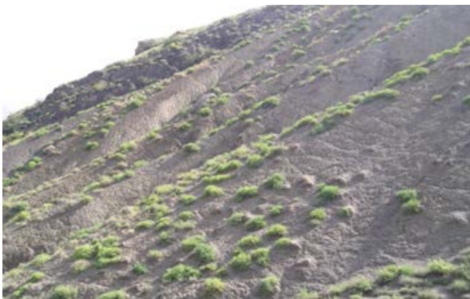
شکل ۳- جامعه Salsoletum dendroidis

این جامعه روی شیب بالاتر از ۶۰ درجه، و خاک‌های با عمق کم، بافت سنگین و نفوذپذیری کم و EC بالا در دامنه برخی از ارتفاعات و به‌طور عمده در جهت شمال‌غربی گسترش دارد. در همین راستا،