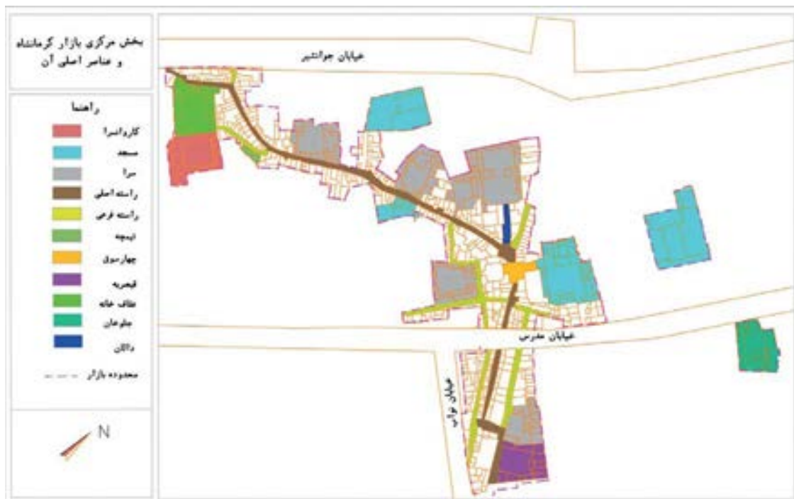
نقشه شماره ۱: بخش اصلی بازار کرمانشاه و موقعیت عناصر اصلی

موازی قرار داشتند. به سمت شرق، راسته آهنگرها و بنکداران، بازار کتفروش‌ها، نان برنجی‌پزها و حلبی‌فروش‌ها و فضاهایی مانند بزازخانه کهنه، بزازخانه نو، راسته فراش‌باشی و قیصریه عناصر عمده بودند (ایراندوست، ۱۳۷۳: ۹۸).