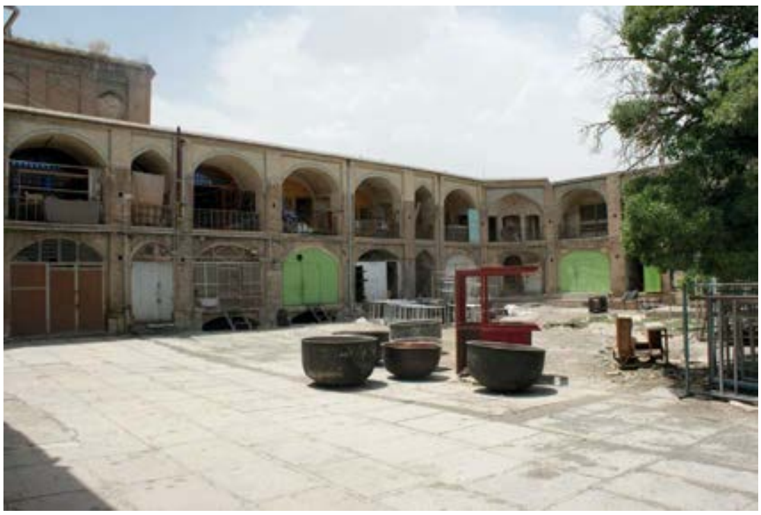
تصویر شماره ۱: سرای وکیل - بازسازی و مرمت هنوز نتوانسته پویایی را جاری کند.