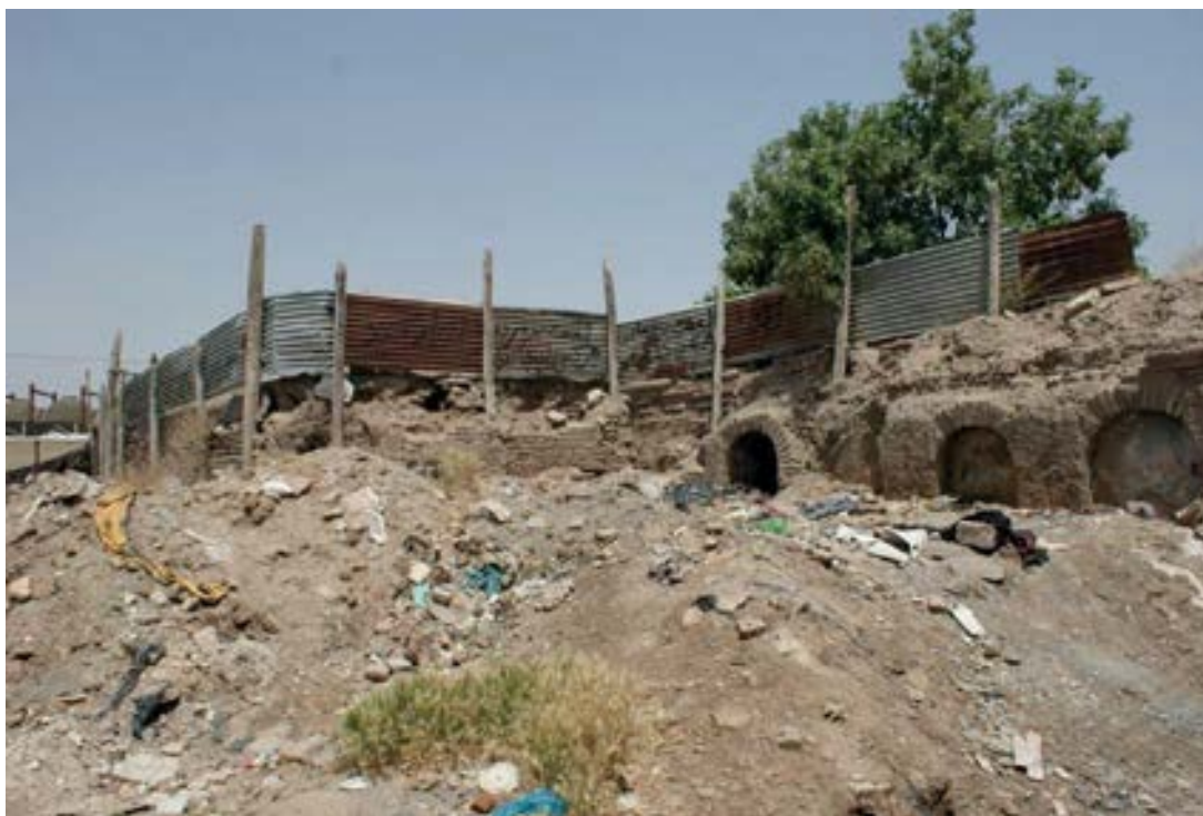
تصویر شماره ۳: مخروبه شدن کاروان‌سراهای بازار توپخانه