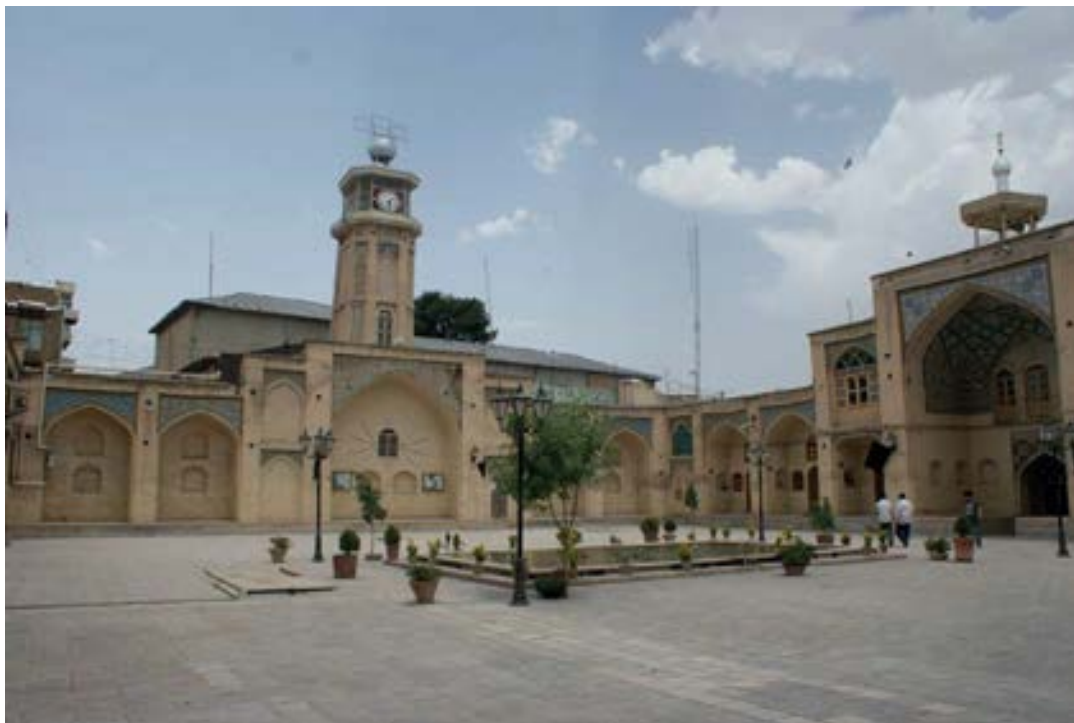
تصویر شماره ۲: مسجد عماد الدوله از عناصر اصلی متصل به چهارسوق