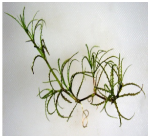
شکل ۹: گونه Najas minor