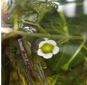
شکل ۱۱: گونه Ranunculus fluitans