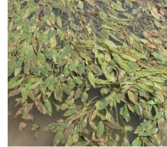
شکل ۴: گونه P. nodosus