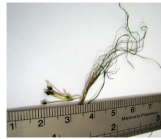
شکل ۱: گونه Ruppia maritima