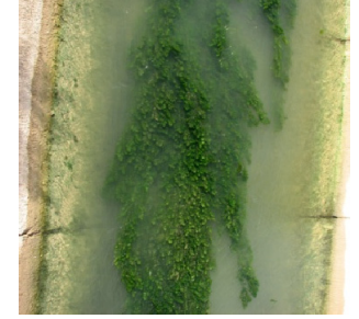
شکل ۱۰: گونه Ceratophyllum demersum