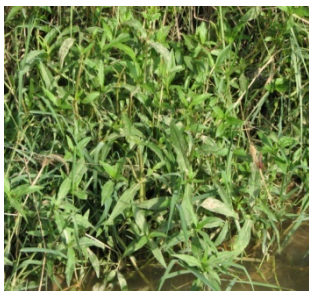
شکل ۱۲: گونه Alternanthera sessilis