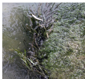
شکل ۸: گونه Vallisneria spiralis