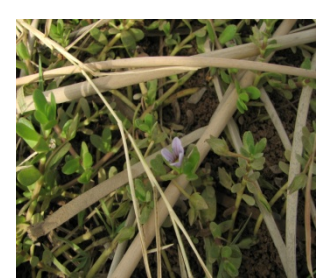
شکل ۷: گونه Bacopa monnieri