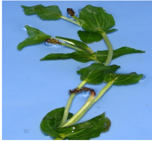
شکل ۶: گونه P. perfoliatus