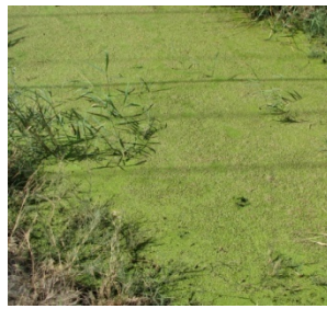
شکل ۲: گونه Lemna gibba