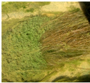
شکل ۳: گونه Potamogeton amblyphyllus