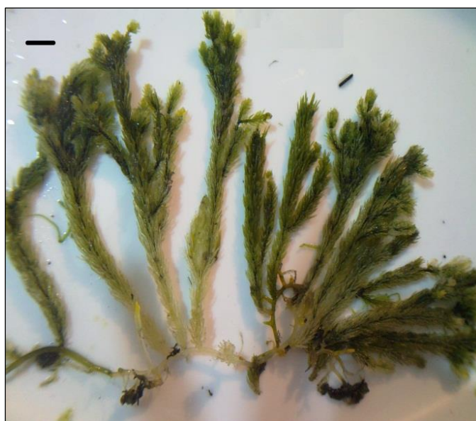
شکل ۱: نمای کلی Caulerpa sertularioides f. farlowii Scale

نتایج حاصل از آنالیز واریانس داده‌ها نشان داد که ظرفیت آنتی‌اکسیدانی نمونه‌ها از نظر آماری در سطح ۰/۰۱ با یکدیگر تفاوت معنی‌دار دارد. IC_{50} اسید آسکوربیک به عنوان کنترل مثبت و مقدار ۴۳/۸۴۴ میکروگرم در میلی‌لیتر ( 0/044 \pm 0/001 میلی‌گرم در میلی‌لیتر) بدست آمد. درصد مهار در رقت ۲ میلی‌گرم در میلی‌لیتر برای کلیه عصاره‌ها محاسبه گردید. جدول ۲ میزان ترکیبات فنلی و فلاونوئید و IC_{50} هر عصاره جلبک را نشان می‌دهد. هرچه میزان IC_{50} کمتر باشد به معنای ظرفیت آنتی‌اکسیدانی بیشتر است. همان‌طور که در جدول مشاهده می‌شود، بیش‌ترین ظرفیت آنتی‌اکسیدانی (با کمترین IC_{50} ) و نیز بیش‌ترین ترکیبات فنلی و فلاونوئید مربوط به نمونه جمع‌آوری شده از دیر (S1) است و کم‌ترین مقادیر نیز در عصاره نمونه نایبند (S4) دیده می‌شود. در شکل ۲ نیز مشاهده می‌شود که نمونه دیر بیش‌ترین مهار رادیکال DPPH را به میزان ۹۲/۵۲۰ درصد برای رقت ۲ میلی‌گرم در میلی‌لیتر در مقایسه با ۳ نمونه دیگر نشان داده است و نمونه نایبند با کم‌ترین میزان مهار به میزان ۱/۶۹۷ درصد در همان رقت کم‌ترین مهار رادیکال و یا به عبارتی ضعیف‌ترین توان آنتی‌اکسیدانی را داشته است.