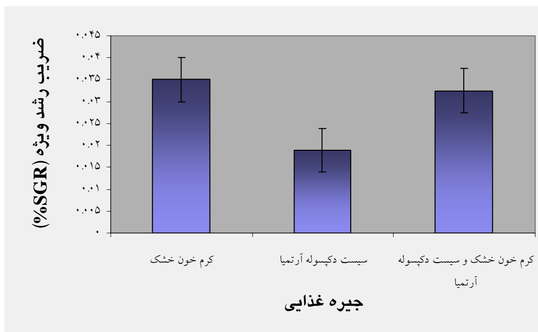
شکل ۱ - ضریب رشد ویژه (SGR) نوزاد فرشته ماهی بر حسب سه نوع جیره غذایی مصرفی (انتنک ها نشان دهنده انحراف معیار است)

حداکثر میزان شاخص ضریب رشد ویژه مربوط به تیمار غذایی کرم خونی خشک برابر 0.035 \pm 0.0083 و حداقل آن مربوط به تیمار غذای سیست پوسته زدایی شده آرتمیا برابر 0.0189 \pm 0.0075 بود و حداکثر میانگین شاخص افزایش وزن، مربوط به تیمار غذای کرم خونی خشک برابر 73/102 \pm 194/444 گرم و حداقل آن مربوط به تیمار غذایی سیست پوسته زدایی شده آرتمیا با مقدار 39/596 \pm 80/318 گرم می باشد. میزان اکسیژن در کلیه مراحل آزمایش در آکواریوم ها با سه نوع جیره غذایی نوسانی نداشته و میزان آن (۷ میلی گرم در لیتر) ثابت بود. ولی در pH آکواریوم ها نوسان (۶/۲-۶/۵) مشاهده گردید (جدول ۱).